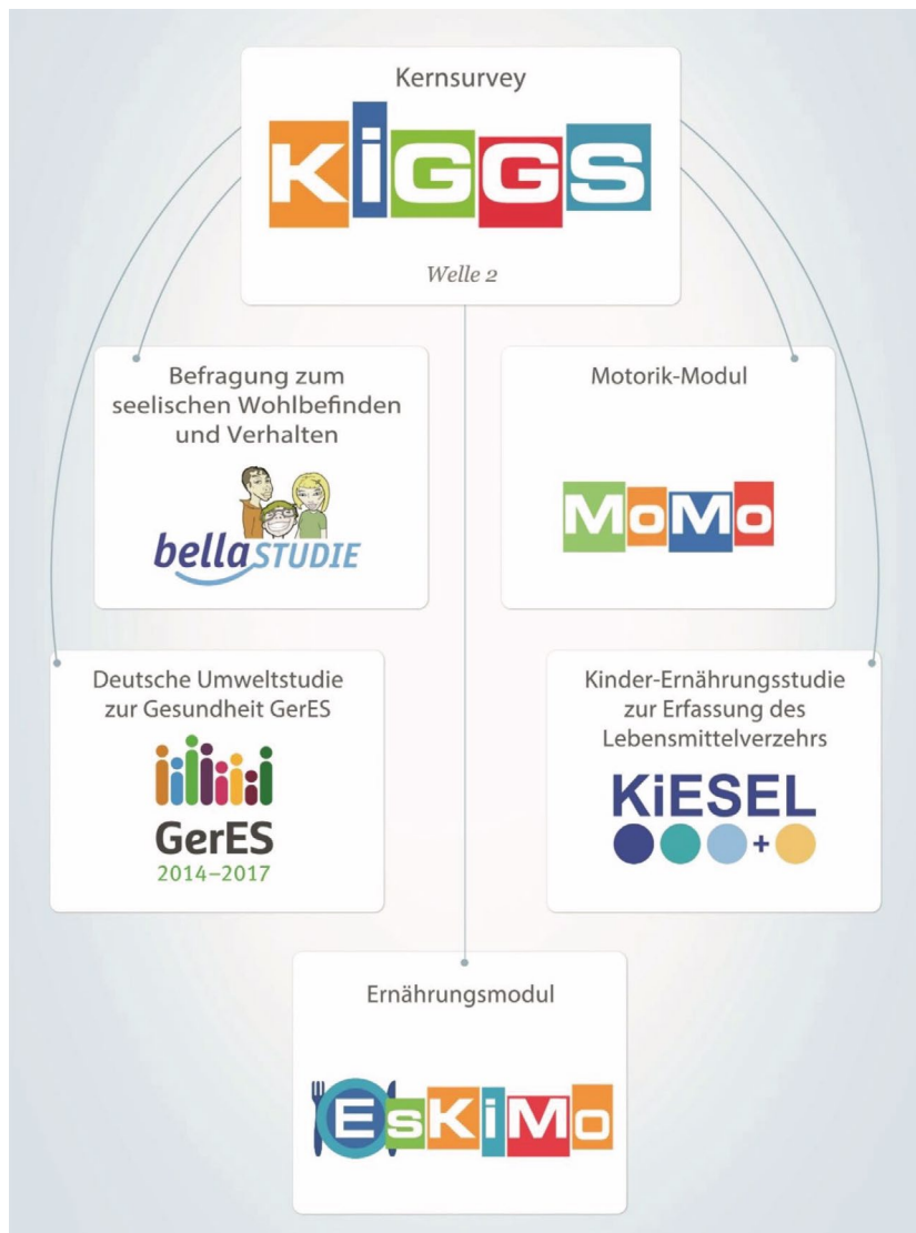
Abbildung 1 Modulstudien in KiGGS Welle 2.