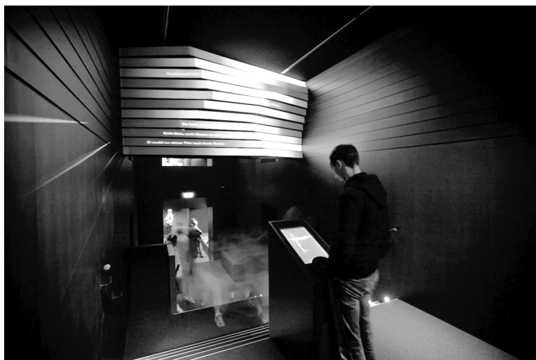
Abb. 3: Projektion der multimedialen Installation in der »Faust-Galerie« der Ausstellung Lebensfluten – Tatensturm im Goethe-Nationalmuseum Weimar.

Im Übergang zwischen den beiden Ausstellungsetagen befindet sich im schwarz gehaltenen Treppenaufgang die sogenannte »Faust-Galerie«. Es handelt sich hierbei um eine Multimedia-Installation, die Goethes Tragödie Faust (erster und zweiter Teil) gewidmet ist. 36 Die Installation ist ein interaktives An-