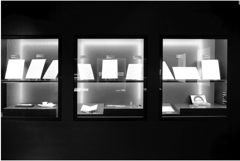
Abb. 2: Ausstellungssituation im sogenannten »Schreibkabinett« der Ausstellung Lebensfluten – Tatensturm im Goethe-Nationalmuseum Weimar.

Während in dieser Ausstellungssituation folglich das Kriterium der Materialität und der Praktiken des Schreibens hervorgehoben wird, bleiben Aspekte wie inhaltliche Motive oder Themen hingegen stärker im Hintergrund; sie werden durch die Art der Präsentation, mithin durch die Relation der Exponate, nicht als Bedeutungsdimension angelegt. Das unterscheidet diese Ausstellungssituation grundlegend von der vorherigen exemplarischen Konstellation, in der der motivisch-thematische Aspekt des Genies als verbindendes Element durch die Präsentation in den Fokus gerückt wurde.