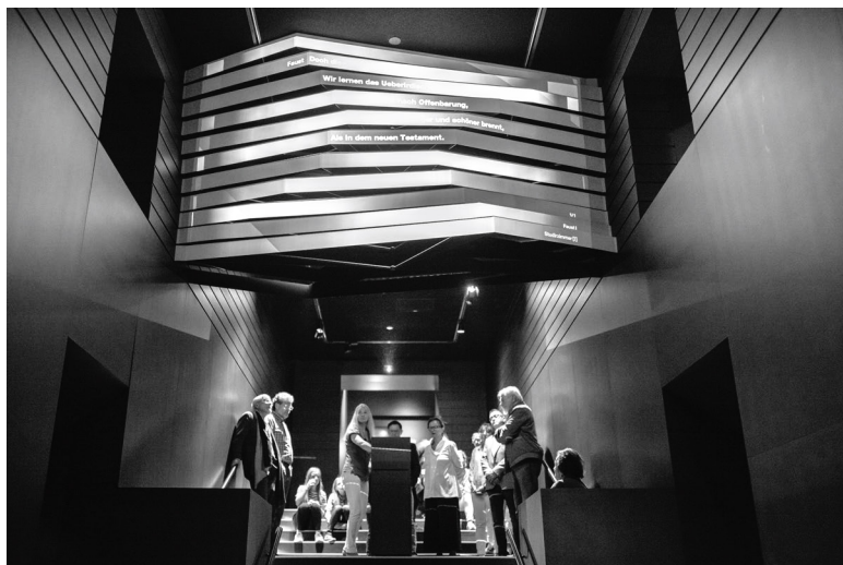
Abb. 4: Projektion der multimedialen Installation in der »Faust-Galerie« der Ausstellung Lebensfluten – Tatensturm im Goethe-Nationalmuseum Weimar.

Die Faust -Installation eröffnet den Rezipierenden den Zugang zur Literatur über das vergleichende Lesen. Die comparata (jeweilige Textstellen aus dem Faust ) sowie das Vergleichskriterium im Sinne von auszuwählenden Stichwörtern (Substantive) sind dabei durch die Installation vorgegeben, können aber unterschiedlich quantitativ oder qualitativ ausgewertet werden. Literatur wird hier in ihrer inhaltlichen Dimension durch die Motivation des lesenden Zugangs erfahrbar gemacht. Dabei wird auch die Wahrnehmung von Literatur in einer zeitlichen Folge deutlich, denn der Vergleich der zu lesenden Textstellen ergibt sich nur in der Zeit. Durch die Parallelstellen-Lektüre ist die Vergleichskonstellation hingegen nicht darauf angelegt, in erhöhtem Maße formalästhetische Aspekte oder gar die Materialität bzw. Schriftbildlichkeit des Textes in den Blick zu rücken. Diese Aspekte treten eher in den Hintergrund bzw. werden unterminiert, wenn – im Kontrast dazu – durch die Multimediaprojektion verdeutlicht wird, inwiefern Literatur ein virtuell zugängliches und quantifizierbares Medium darstellt. Diese Form der Inszenierung und Rezeption von Literatur unterscheidet sich insofern grundlegend von dem Kabinett, in dem Autografe und Schreibwerkzeuge ausgestellt werden.