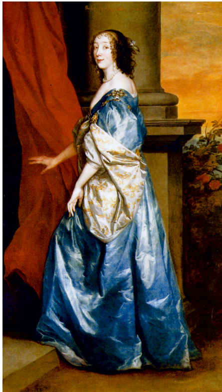
Abb. 4: Anthonis van Dyck: Portrait der Lucy Percy, Countess of Carlisle, 1637, Öl auf Leinwand, 217.9 x 140.3 cm, Privatsammlung.

Dabei fällt auf, dass die Dichter dem Maler eine Kraft zuschreiben, die die dargestellten Personen in ein ästhetisches Ereignis verwandelt. Als ›Poems of Praise‹ heben sie die eidetische Qualität, d.h. die vornehmlich demonstrativ verfahrenenden