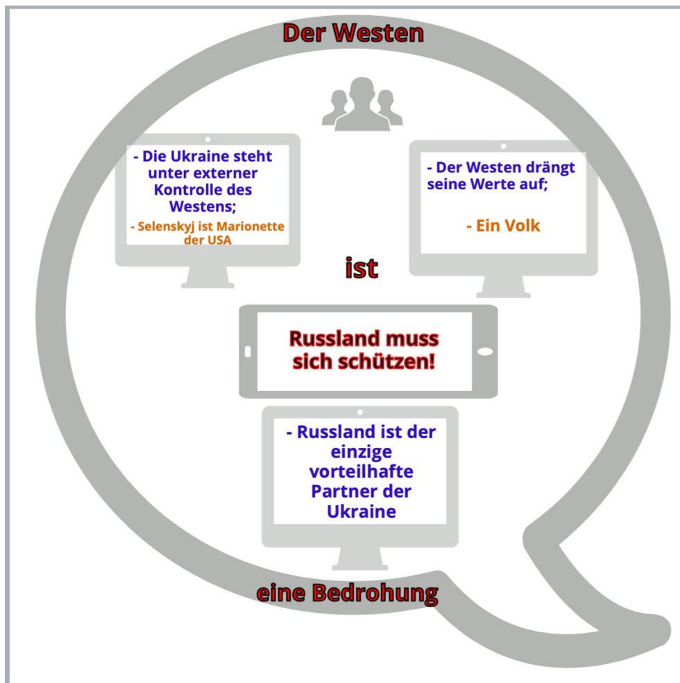
Abb. 2. Die Struktur der strategischen Narrative Russlands in den Jahren 2019-2022. Quelle: Eigene Erhebung

Nur die heutige Regierung ist in der Lage, dies zu tun. Dabei ist die internationale Interaktion als weiterer Legitimitätsanspruch auch stark im russischen strategischen Narrativ vertreten. Dies zeigt sich am Beispiel des Sub-Narrativs, dass Russland der einzige und wichtigste Partner der Ukraine in allen Bereichen – von der Wirtschaft bis zur Sicherheit – ist; Das gilt auch für das andere Narrativ von Russland als einem der einflussreichsten Zentren der modernen Welt.