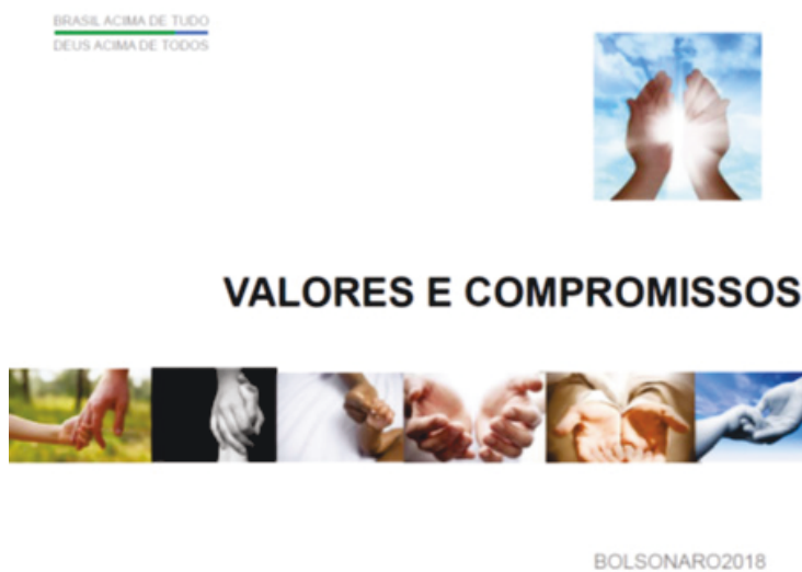
Imagem 1.2. Página introdutória do capítulo “Valores e Compromissos do programa eleitoral de Bolsonaro (2018) (Fonte: TSE (2018); Licença: veja-se nota-de-rodapé no.8).

No entanto, o programa de Bolsonaro (2018) contém mais ofertas de identificação religiosa. O primeiro capítulo do programa intitulado “Valores e Compromissos” é acompanhado por uma iconografia comum de grupos religiosos na base de apoio de Bolsonaro: