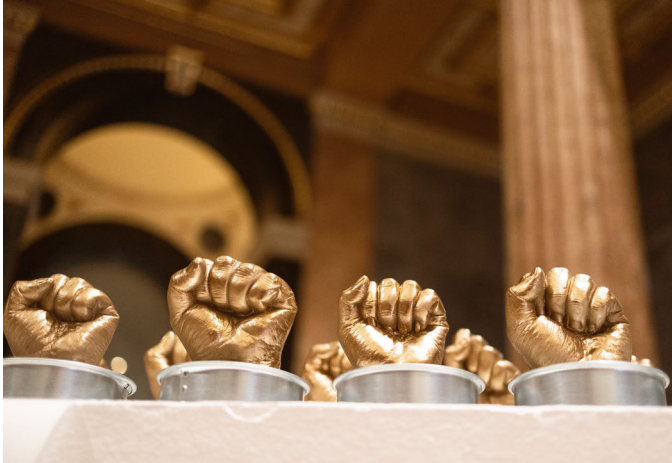
Installation: Wessen (Kunst-)Freiheit? Anahita Neghabat & Asma Aiad, Muslim*Contemporary 2022

Unsere Fäuste stehen weiter Seite an Seite solidarisch gegen Rassismen, Sexismen, Queerfeindlichkeit und jede Form von Diskriminierung.