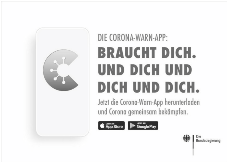
Abbildung 2: Motiv aus der Werbekampagne zur Corona-Warn-App 2

die App von der Bundesregierung in Auftrag gegeben worden ist. Vereinzelt befindet sich auch auf der rechten Seite oben ein QR-Code, über den man zur App gelangt.