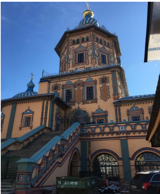
Die Peter-und-Paulskathedrale in Kasan (18. Jh.), mit sichtbaren Anleihen tatarischer Ornamentik

Die in Charles Taylors Theorie skizzierte Säkularität 1 (mit welcher die prinzipielle Sphärentrennung in religiöse und nichtreligiöse Regelungsbereiche gemeint ist) 85 , ist hier im Prinzip vorhanden, aber schwach ausgeprägt. Der Islam kennt in seinen Anfängen diese Trennung überhaupt nicht und tritt gleich als kompakte religiös-politische Ordnung mit universalem Anspruch in die Weltgeschichte 86 , d.h. spätere Säkularitäten müssen historisch erlernt und können nicht aus der frühislamischen Geschichte abgeleitet werden. Die Goldene Horde war, wie oben gezeigt, ein sehr eindrückliches Beispiel davon, wie die Trennung von Religion und Politik nachträglich dennoch ins Spiel kommen konnte. Das tolerante