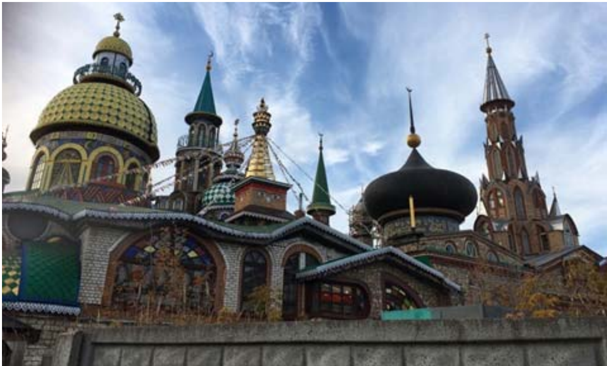
Der „Tempel aller Religionen“, Staroe Arakčino bei Kasan