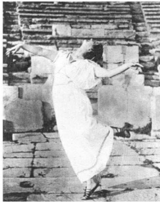
Abb. 8 Duncan 1903 im Theater des Dionysos. (D. Duncan: Life into Art , S. 57)

Duncan war ganz im Trend der Zeit, wenn sie die Zukunft im antiken Griechenland sah. Um sie in ihren Tänzen zur Erscheinung zu bringen, nahm sie Abbildungen rasender Mänaden auf antiken Vasen zum Vorbild. Und das Ergebnis ließ sich sehen.