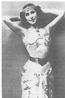
Abb. 4 Matil' da Kšesinskaja in der »Bajadere« ca. 1898.

selben Lehrern gelernt hatten, Welten lagen. 70 Die Pavlova und Koesinskaja waren Tänzerinnen aus zwei verschiedenen Epochen. 71