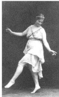
Abb. 3 Duncan 1903 in einer Pose aus »Narziss«, Chopin op. 64, Nr. 2.

Hatten bis 1899 noch rosa Strumpfhosen und Tanzschlappchen Isadora Duncans Beine geziert, so waren Beine und Füße jetzt nackt. Ihre Arme waren unverhüllt, der Körper vom Korsett befreit. Doch sie hatte nicht alle Hüllen fallen lassen. Eine leichte Tunika umgab noch ihren bloßen Körper. 1