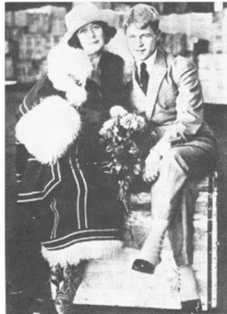
Abb. 9 Während Duncan sich 1922/23, unterwegs in Europa, in ein russisches Phantasiekostüm hüllte, inszenierte Esenin sich als Dandy.

von »primitiven Jazztänzen«, deren Rhythmen unterhalb die Gürtellinie zielen und in denen sich die Menschen nur in »sabbernden, affen-ähnlichen Konvulsionen« verrenken würden. 22