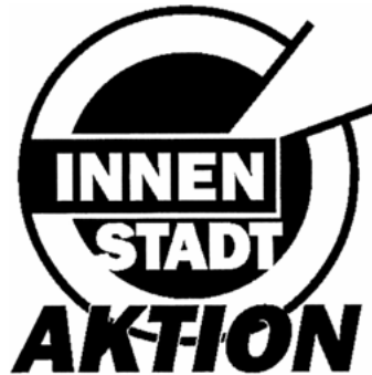
Abb. 3: gemeinsames Logo der überregionalen InnenStadtAktionen

Nachdem auf diesem Koordinierungstreffen im Januar 1997 gemeinsam einige Grundsatzfragen erörtert wurden, wird die Planung der InnenStadtAktionen dezentralisiert, d.h. die weitere Vorbereitung der InnenStadtAktionen wird von den beteiligten lokalen Vorbereitungsgruppen übernommen und die jeweiligen Diskussionsergebnisse über einen E-Mail-Verteiler anderen Gruppen zugänglich gemacht. Als gemeinsame Klammer wird im Protokoll des Koordinierungstreffens festgehalten, mit einem einheitlichen Logo zu arbeiten, um Wiedererkennbarkeit zu erzielen, in Publikationen möglichst alle beteiligten Städte zu nennen und eine gemeinsame Zeitungsbeilage für überregionale Zeitschriften und Zeitungen herauszugeben, in der zum einen theoretische Beiträge aus dem Vorbereitungstref-