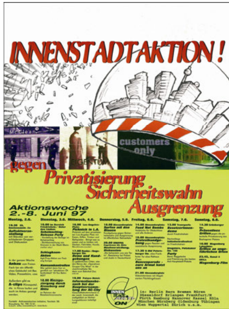
Abb. 7: Plakat zu den InnenStadtAktionen 1997 in Berlin

In Berlin finden sowohl 1997 als auch 1998 InnenStadtAktionen statt. Zum Vorbereitungskreis der Aktionswochen zählen verschiedene Gruppen und Einzelpersonen, die bereits vorher zu verschiedenen politischen Themen arbeiten. Ein großer Teil der AktivistInnen stammt aus politischen Kunstzusammenhängen, die bereits an „Messe 20k“, „Minus 96“ oder dem Projekt „Common Spaces? Common Cocerns?“