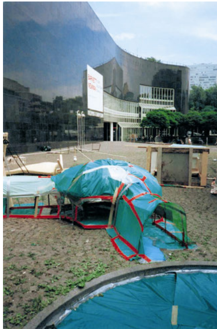
Abb. 14: „Lagerplatz“ an der Kunstsammlung Nordrhein-Westfalen (InnenStadtAktionen 1997 in Düsseldorf)