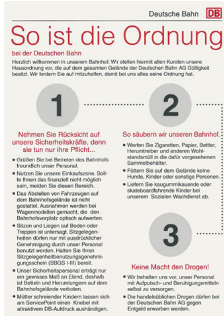
Abb. 9: Gefaketer DB-Flyer (InnenStadtAktionen 1997 in Berlin)

[...] Wird die Spannung zwischen Form und Inhalt bewusst eingesetzt, dann kann eine gekonnte und witzige Camouflage durchaus ihr Ziel erreichen: