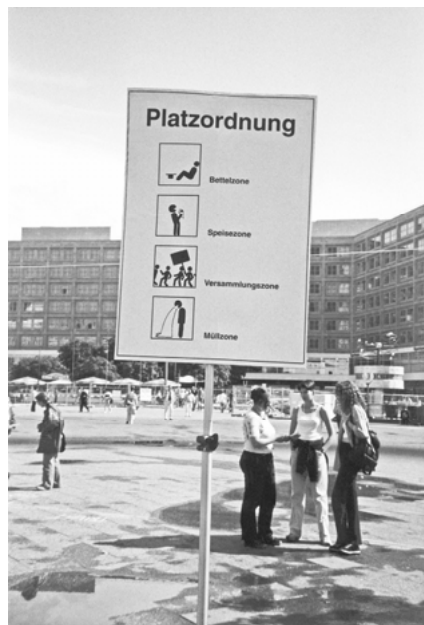
Abb. 11: „Entern öffentlicher Plätze“ (InnenStadtAktionen 1998 in Berlin)

Ähnlich wie in Köln werden auch in Berlin vielfach Orte durch temporäre Besetzungen für andere als die üblicherweise vorgesehenen Nutzungen geöffnet: Beispielsweise durch Picknicks im Bahnhof Zoo (5.6.1998) 232 oder auf dem privatisierten Los Angeles Platz (4.6.1997) 233 , bei denen offensiv gegen die jeweiligen Hausordnungen verstoßen wird, durch eine spontane Lesung im Kulturkaufhaus Dussmann, bei der Texte des Innenministers Manfred Kanther und des Berliner Senatsabgeordneten Klaus Rüdiger Landowsky vorgetragen werden 234 , oder durch das „Entern öffentlicher Plätze“ (3.6.1998), bei dem PassantInnen auf dem Alexanderplatz dazu aufgefordert werden sich mit Hilfe eines Stücks Kreide eine beliebig großes Areal anzueignen und dort eine eigene Platzordnung zu erlassen 235 . AktivistInnen verkleiden sich bei dieser Aktion als PiratInnen, die auf ihrem Gebiet den Genuss von Alkohol, das Abspielen von Musik, das Rauchen von Haschisch oder Skateboardfahren, also Verhaltens-