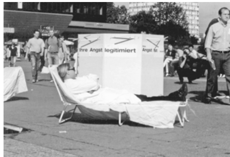
Abb. 10: „Therapie der paranoiden Massen“ (InnenStadtAktionen 1998 in Berlin)