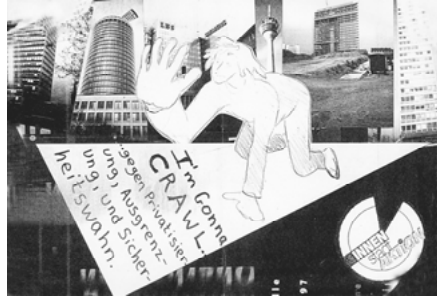
Abb. 13: Flyer zu John Dunns „Krabbelaaktion“ (InnenStadtAktionen 1997 in Düsseldorf)

Wenngleich die Aktion kein pädagogisches Konzept verfolgt, sondern eher auf die Eigendynamik des Zusammenarbeitens setzt, kann beispielsweise das gemeinsame Zeichnen als eine Form des Empowerments gelesen werden, wie Nina Felshin skizziert: