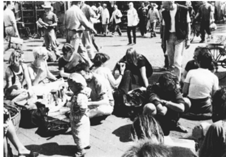
Abb. 5: Picknick in der Schildergasse (Klassenfahrt 97)

„Klassenfahrt im Selbstversuch: Kann man in der Schildergasse noch etwas anderes tun als Einkaufen? Und wenn ja, wie lange? Parallel informiert