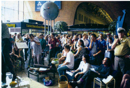
Abb. 6: Bahnhofswohnung im Kölner Hbf (Klassenfahrt 97)

Durch die Errichtung einer „Bahnhofswohnung“ in der Haupthalle des Kölner Hauptbahnhofs laden die InitiatorInnen der Kölner Klassenfahrt zum Verweilen ein. Darüber hinaus werden durch offensive Verstöße gegen die Hausordnung, beispielsweise durch Musizieren, Handlungsspielräume ausgelotet. Im Gegensatz zur „Bonzendemo“ bietet diese Aktionsform wie auch das Picknick in der Innenstadt und das Frühstück auf der Domplatte niedrigschwellige Möglichkeiten zur Partizipation zunächst Unbeteiligter. Die Bereitstellung von Ses-