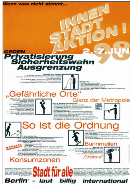
Abb. 8: Plakat zu den InnenStadtAktionen 1998 in Berlin

jene, die an bestimmten Orten stattfinden und je nach Konnotation dieser Orte von bestimmten Szenen und einer interessierten Teilöffentlichkeit besucht werden. Wie gut die einzelnen Aktionen jeweils den Sinn der Informationsvermittlung erfüllen braucht an dieser Stelle nicht im Detail geklärt zu werden. Der wesentliche Punkt ist, dass neben der Besetzung nur begrenzt zugänglicher Orte und neben Aktionen, die dem