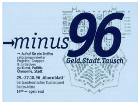
Abb. 2: Einladungsflyer zur „Minus 96“

mehr ein Koordinierungstreffen mit weitaus geringerer TeilnehmerInnenzahl. Bereits während der Vorbereitung der „Minus 96“ wird entschieden, diese als Vorbereitungstreffen für eine weitere, auf einen größeren Rahmen hin angelegte Aktion zu nutzen, die sich thematisch mit