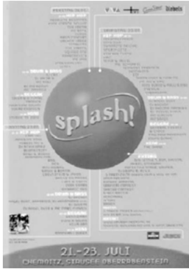
Abbildung 1: „splash!“ Flyer 1999