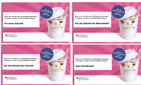
Abbildung 3: Darstellung der Stimulus-Varianten der drei experimentellen Gruppen und der Version ohne Value-Based-Framing (egoistisches Framing, altruistisches Framing, biosphärisches Framing, kein Value-Based-Framing)

Sowohl das Stimulusmaterial als auch der Fragebogen wurden in einem qualitativen Pre-Test mit fünf Teilnehmenden als Evaluationsverfahren vor der eigentlichen Befragung analysiert. Allen Pre-Test Teilnehmenden wurden alle Stimulus-Varianten und der Fragebogen vorgelegt und diese wurden zur wahrgenommenen Aussage der Plakate, zur Verständlichkeit, zu möglichen Fehlern und zu Optimierungsmöglichkeiten befragt. Die Stimulus-Varianten wurden entsprechend des Value-Based-Framings wahrgenommen.