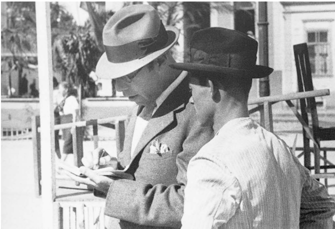
Abbildung 2: Mário de Andrade bei der Feldforschung im Bundesstaat São Paulo, zwischen 1935 und 1937 aufgenommen.