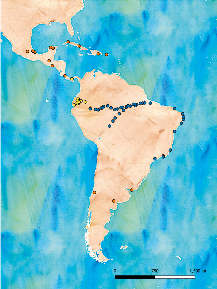
Abbildung 1: Reisewege der drei Autoren. Gabriela Mistral ● Mário de Andrade ● Henri Michaux ●