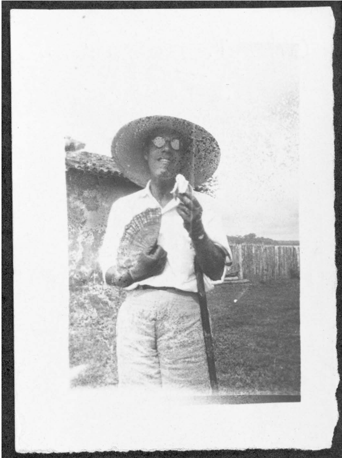
Arquivo IEB-USP/Sammlung Mário de Andrade, MA-F-0273

Die verschiedenen Interpretationsmöglichkeiten zeigen, dass die Fotografie Simultaneität darstellt: das vermeintlich Weibliche (Fächer) und Männliche (Spazierstock), das Urbane und Rurale sowie Reichtum und Armut. Die Dimensionen Brasiliens sind in »Aposta de Ridículo [sic!]« auf einen Blick sichtbar, womit zugleich