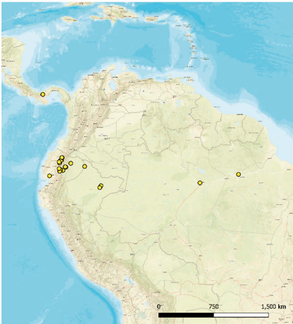
Abbildung 9: Reisewege Henri Michaux

Während Mistral und Andrade zu ihren Reisen aufbrachen, schiffte sich auf der anderen Seite des Atlantiks ein junger belgischer Künstler auf einem Dampfer Richtung Lateinamerika ein. Als er im Jahr 1927 in See stach, hatte der 28-jährige Michaux bereits ein abgebrochenes Medizinstudium sowie eine kurze Karriere als Matrose und einen längeren Aufenthalt in Paris hinter sich. 1 Im Umfeld