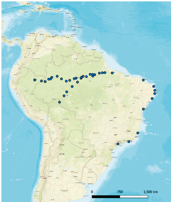
Abbildung 4: Reisewege Mário de Andrade

Bis zum Börsencrash im Jahr 1929 führte der Kaffeeboom in Brasilien zu einem rasanten Wirtschaftswachstum, das Migranten aus aller Welt in das Land zog – Schiffe aus Deutschland, Italien, dem zerfallenden Osmanischen Reich und Japan dockten in São Paulo an und ließen die vormals am Fluss Tietê von Jesuiten er-