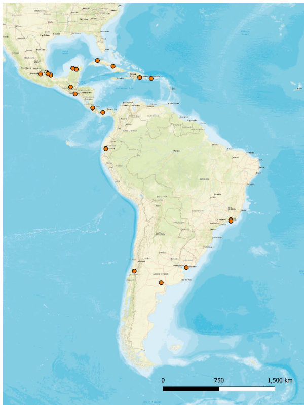
Abbildung 3: Reisewege Gabriela Mistral

Als 1889 im entlegenen chilenischen Valle de Elqui Lucila Godoy Alcayaga auf die Welt kam, ahnte niemand, dass sie als Gabriela Mistral zu einer der wichtigs-