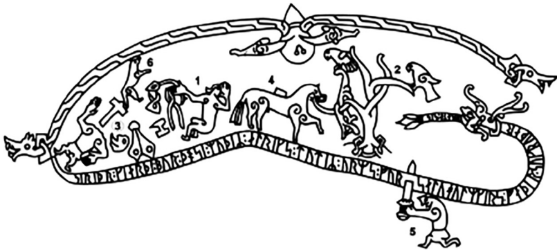
Abb. 2: Steinritzung Ramsund-Stein (Nachzeichnung; Zahlen nachträglich) 17

Unzweideutig gilt der christliche Bezug jedoch im Zusammenhang mit den beschriebenen Sakralbauten. Offensichtlich verbanden sich mit der profanen, zunächst un- oder vorchristlichen Heros-Gestalt eben auch Vorstellungsgehalte einer christlichen Interpretationsebene. Die Frage, die sich hier stellt, ist also: Wie lässt sich Sigurd, der archaisch-heidnische Held als Exponent einer christ-