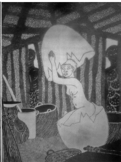
(Siege 1993: 7)