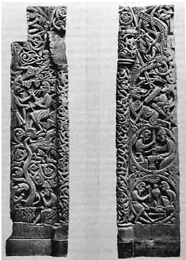
Abb. 1: Portal von Hylestad (aus Millet 2008: 157)

Ganz zweifellos wird diese Erzählung im Bildprogramm von Holzschnitzereien norwegischer Sakralbauten aus der Zeit um 1200 wiedergegeben. Am bekanntesten ist das Portal der norwegischen Stabkirche von Hylestad (Abb. 1).