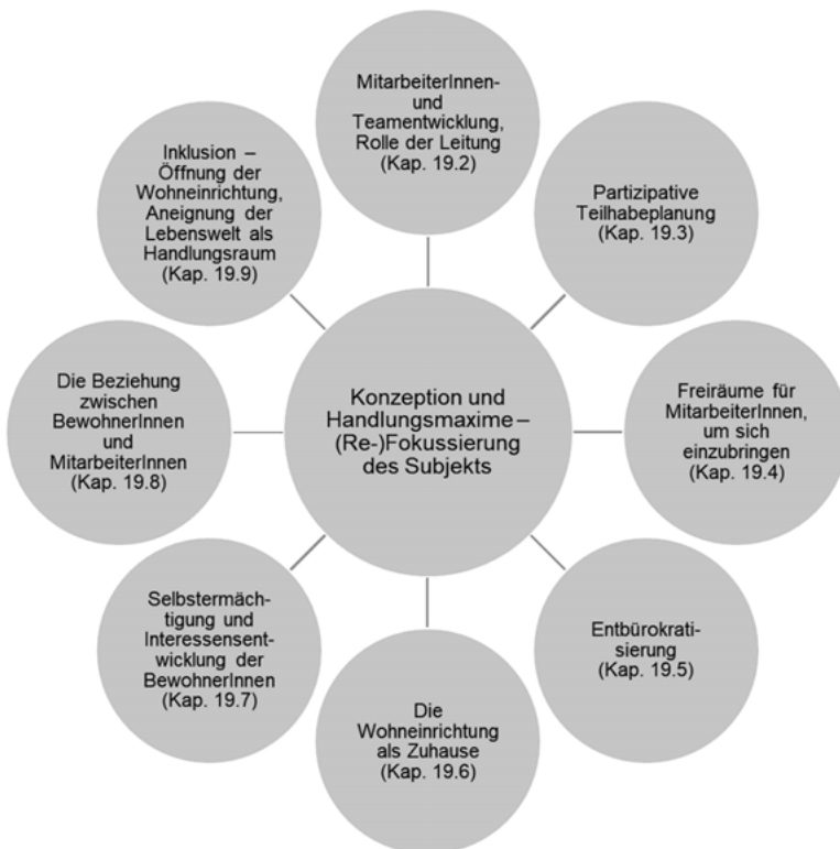
Abbildung 1: Konzeption und Handlungsmaxime – (Re-)Fokussierung des Subjekts

pädagogischen Konzept und zeugt zudem davon, wie sehr die einzelnen Aspekte miteinander zusammenhängen. Das verdeutlicht auch, dass die Arbeit am pädagogischen Konzept nicht als singuläre Maßnahme erfolgen kann, sondern dass es sich dabei um einen Prozess handeln muss, der sich diskursiv vollzieht. Die untenstehende Übersicht sowie die darauffolgende Tabelle zeigen die in diesem Kapitel aufgeführten Ideen hinsichtlich der Entwicklung eines pädagogischen Konzepts, das von einer (Re-)Fokussierung des Subjekts ausgeht. Darin wird zudem ein erster Eindruck der Vielgestaltigkeit konzeptioneller Ideen vermittelt, die bei einer solchen Entwicklung eines pädagogischen Konzepts eine Rolle spielen.