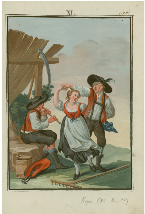
Abb. 1: StLA, Handschrift 580 (»Knaffl-Handschrift«, 1813), XI, pag. 385: »Eine Tanzattidüde, eigent- lich Scene einer Erhohlung nach der Mahd«. Illustration von Johann Lederwasch.

deren einige zimlich derb und ausgelassen sind«, wird 1815 aus Aflenz be- richtet. 26