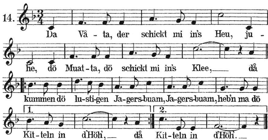
Abb. 3: Beispiel für die Veröffentlichung von Melodie und Text durch ›Privatdrucke‹ um 1900, aufgezeichnet in Türnitz a. d. Traisen, Bezirk Lilienfeld, Niederösterreich. Quelle: Erotische Volkslieder aus Deutsch-Österreich mit Singnoten . Gesammelt und hrsg. von Emil Karl Blümmel (Privatdruck). Wien 1906, S. 39, Nr. XVII und S. 157, Nr. 14.