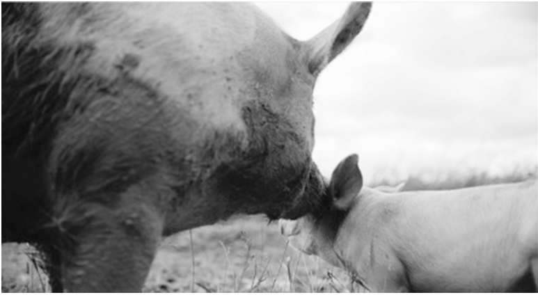
Abb. 9: Filmstill aus GUNDA (NOR/USA 2020 R: Kossakovsky).