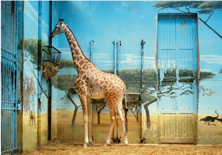
Abb. 7: Candida Höfer (1997), Zoologischer Garten Paris II .

In Candida Höfers Fotografie Zoologischer Garten Paris II (Abb. 7) tritt eine lebendige Giraffe in ein Wechselspiel mit ihrer piktoralen Inszenierung als Wildtier. Vor der blauen Farbe, mit der ein Himmel über eine ebenfalls gemalte Savannenlandschaft gesetzt wurde, in die vereinzelt andere Tiere eingelassen sind, erscheint die Giraffe als Teil eines Bildes. Die Giraffe wird gleich doppelt