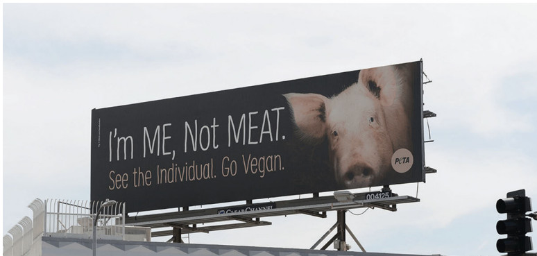
Abb. 5: PETA, Kampagne »I'm Me, Not Meat«.

Im Folgenden werde ich eine für die Ansätze relationaler Ethik in den Animal Studies wegweisende Implikation meiner Überlegungen vorstellen: Fotografien haben ein besonderes Potenzial, vermittels ihrer Transparenz Nähe herzustellen, indem sie einzelne Tiere sichtbar machen. Anders als die spezifischen Fragen der Repräsentation, die stärker den Gebrauchskontext des Bildes betreffen, ist die Transparenz im Medium der Fotografie selbst angelegt. Qua Repräsentation können sie Tiere sowohl als singuläre wie auch als stellvertretende zeigen. Im Verhältnis zwischen diesen transparenten und den repräsentierenden Aspekten einer jeden Fotografie sehe ich nun ein besonderes Potenzial angelegt. Auf einer Fotografie lässt sich stets ein konkretes Tier sehen, selbst dann, wenn der Bildgebrauch eher auf die verallgemeinerten Aspekte des Tiers verweist. Damit ist die Prämisse für kritische Perspektiven gegen den üblichen Gebrauch eines Bildes genannt. Unter dem Begriff der Lesarten gegen den Strich schlage ich vor, das kritische Potenzial von Fotografien und schließlich auch von filmischen Bildern für die Animal Studies neu zu bewerten.