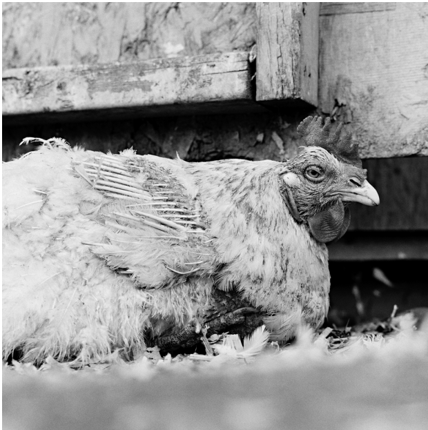
Abb. 13: Isa Leshko, This rooster, age unknown, was a factory farm survivor. Die Abbildung ist entnommen: Leshko et al. 2019, Allowed To Grow Old, University of Chicago Press: 19. © Isa Leshko.

Anhand dieser Fotografie und des Weiteren fotografischen Projekts Isa Leshkos lässt sich erläutern, inwiefern uns das sichtbarwerdende Altern von Nutztieren in eine Beziehung zu Tieren als singuläre Tiere und zu geteilten Erfahrungen der Vulnerabilität bringen kann. Menschen und andere Tiere unterscheiden sich auf graduelle, vielfältige Weise. Das Altern und die Bedürfnisse am Ende eines Lebens ähneln sich jedoch in wesentlicher Hinsicht. Das Besondere an den Aufnahmen von Leshko ist, dass sie uns das Altern von Tieren und die spezifischen Abhängigkeitsverhältnisse, in denen sie in dieser Phase ihres Lebens stehen, zeigen und diese darüber hinaus als etwas nicht Negatives präsentieren. Die Tiere werden in ihrer Würde sichtbar. Die Bilder legen in diesem Sinne eine fürsorgliche Wahrnehmung nahe.