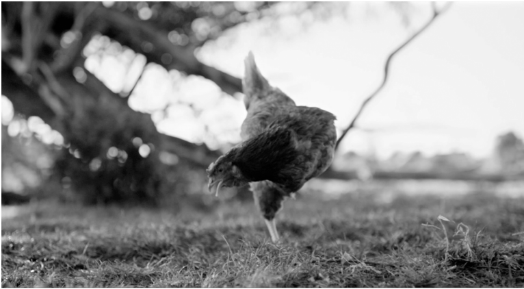
Abb. 4: Filmstill aus GUNDA (NOR/USA 2020 R: Kossakovsky).

(2) Zu sehen, wie vital sich das einbeinige Huhn bewegt, kann das Verständnis bedingen, dass es trotz körperlicher Einschränkung ein Leben führt, das wir schützen sollten (vgl. Abb. 4). 120 (3) Eine Fotodokumentation über Schweine zu betrachten, die durch menschliche Hand leiden, kann uns die Ungerechtigkeit der Tierindustrien aufzeigen. Zwar ist es für die soziale Anerkennung essenziell, dass wir diese Sichtbarkeit, wie oben beschrieben, im Lichte unseres moralischen Handelns begreifen und dies geschieht nicht automatisch. Dennoch ermöglicht es die verkörperte Anwesenheit von konkreten Subjekten, Eigenschaften eines anderen als ethisch und sozial wichtige Eigenschaften zu begreifen. Wie eine Gesellschaft aussehen sollte, die den Eigenheiten und Bedürfnissen von nichtmenschlichen Tieren gerecht werden kann, können wir nur verstehen, wenn wir möglichst viele von ihnen aufmerksam beobachtet haben, das Wissen zusammentragen und in konkreten Fällen und Kontexten ihre Singularität beachten. Sichtbarkeit a+b ist insofern konstitutiv für dasjenige, was ich bereits als relationale Perspektive auf Tieren behandelt habe. Entsprechend gehe ich im Folgenden davon aus, dass bestimmte, noch näher zu definierende Bilder Sichtbarkeit a+b von Tieren herstellen, wenn die Tiere physisch, d.h. im visuellen Feld als konkrete Individuen und in ethisch-politischer Hinsicht, sichtbar werden. In meinen obigen Beispielen – Kuh, Huhn und Schwein – handelte es sich jeweils um solche,