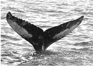
Abb. 1: Allied Whale, Callisto . Aus: Hayward 2011: 178.