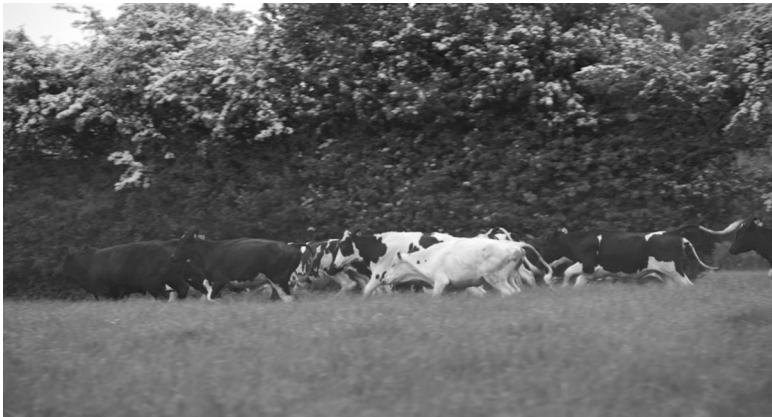
Abb. 3: Filmstill aus GUNDA (NOR/USA 2020 R: Kossakovsky).

Was ich im Folgenden weiter entwickeln möchte, ist die These, dass die physische Sichtbarkeit a und die ethisch-moralische Sichtbarkeit b für die meisten Anerkennungsprozesse von Tieren konstitutiv sind. Die physische Sichtbarkeit stellt nicht eine beiläufige Bedeutung von Sichtbarkeit im zweiten Sinne dar, sondern kann diese in vielen Fällen erklären. Hierzu möchte ich drei Beispiele geben. Die ersten beiden sind dem Dokumentarfilm GUNDA (NOR/USA 2020 R: Kossakovsky) entnommen. Zwei Filmstills sollen an dieser Stelle exemplifizieren, wie Sehgewohnheiten durch unkonventionelle Aufnahmen infrage gestellt werden. (1) Zu sehen, wie ausgelassen Kühe über die Weide rennen, gibt uns die Möglichkeit, ihr Bedürfnis nach Bewegungsfreiheit und Spiel zu erkennen und anzuerkennen (vgl. Abb. 3). 119