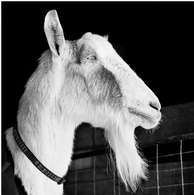
Abb. 12: Isa Leshko, Abe. An Alpine goat, age 21, was surrendered to a sanctuary after his guardian entered an assisted living facility. Die Abbildung ist entnommen: Leshko et al. 2019, Allowed To Grow Old, University of Chicago Press: 23.

Betrachten wir das Porträtfoto der Ziege. Die Beziehung zwischen Tier und Mensch lässt sich hier weder unmittelbar aus dem Bildinhalt heraus verstehen, noch spielt der Blickkontakt eine Rolle. Und doch birgt dieses Bild ein besonderes relationales Potenzial. Das Foto zeigt ein Individuum namens Abe im Alter von 21 Jahren, ein für Ziegen hohes Alter. Das Bild stammt aus einer Reihe der