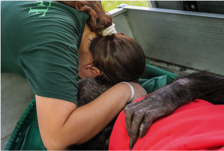
Abb. 11: A staff member hugs Spock's body as she says her goodbyes.