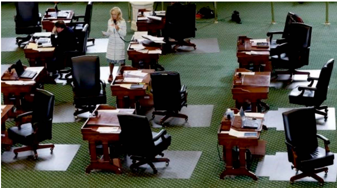
Abb. 1: Wendy Davis im Juni 2013 im Senat von Texas in Austin: Filibuster gegen die geplante Verschärfung des Abtreibungsgesetzes