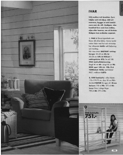
IKEA-Katalog Schweden 2000, S. 93 (© Inter IKEA Systems B.V., URL: < https://ikeamuseum.com/en/digital/ikea-catalogues-through-the-ages/2000s-ikea-catalogues/2000-ikea-catalogue/ >.

Pinselfarbeite in der Hand hält. 87 Schon bevor der Katalog eingestellt wurde, fand IVAR einen neuen Platz im minimalistischen »Schöner Wohnen« der Blogosphäre und eroberte dort als komplett verschlossenes, matt-monochrom bepinseltes Signature Piece auch das Altbau-Wohnzimmer mit Stuck an den Decken. 88 In der Bastler*innen-Szene rund um »IKEA-Hacks« werden Informationen zu möglichen alternativen Möbel-Versionen geteilt sowie zuweilen auch von IKEA selbst aufgegriffen und weitergeführt. Als Allrounder im IKEA-Sortiment ist IVAR auf Instagram und Pinterest zum Star geworden. Zu seinem Aufstieg in der Möbel-Hierarchie dürfte nicht nur seine anhaltende Wandelbarkeit beigetragen haben, sondern gerade seine Materialität. Kiefernholz wird von IKEA als umweltbewusstes Material gefeiert, und IVAR erscheint damit auch auf den genannten Social-Media-Plattformen als zeitgeistiges Möbel schlechthin, in seiner Materialität bestechend »echt«. Entgegen den schönen neuen Oberflächen fördert ein Blick in die Kataloge als medienhistorische Quelle zutage, dass Materialaspekte damals wie heute das Wohnen tragen: »Unser Stammbaum ist die Kiefer«, 89 hieß es schon in den 1970er-Jahren, als fast das gesamte Warensortiment noch aus Vollholz war, insbesondere aus Kiefernholz. Und auch damals gab es bereits Lieferschwierigkeiten, wie es noch eigentümlich unverhohlen im Editorial verkündet wurde. 90 Waren