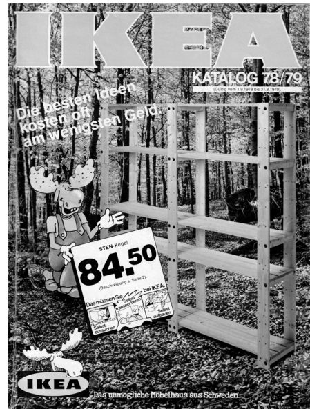
IKEA-Katalog Deutschland 1978/79, Titelseite (© Inter IKEA Systems B.V.)

In der Bundesrepublik erschien der IKEA-Katalog seit 1974 einmal jährlich. Während er zu Beginn nur im Warenhaus verfügbar oder per Coupon aus dem vorherigen Katalog bestellbar war, wurde er später jedes Jahr im August per Postwurfsendung und ab 2013 – aufgrund verschärfter Datenschutzbestimmungen – ausschließlich persönlich adressiert zugestellt. 24 Seit Erscheinungsbeginn kamen stetig weitere Sonderkataloge zu bestimmten Einrichtungsschwerpunkten wie Küche, Schlafzimmer