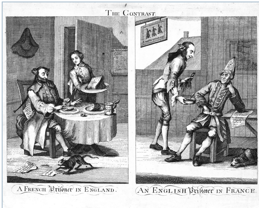
The contrast: a French prisoner in England; an English prisoner in France [1758], Courtesy of The Lewis Walpole Library, Yale University (CC0 1.0).

schichte hat der Pillauer Postmeister Johann Ludwig Wagner dokumentiert, der nach einer Verschwörung mit dem Ziel einer preußischen Einnahme Pillaus nach Sibirien verbannt wurde, die Verbannung überlebte und nach Kriegsende zurückkehrte 72 .