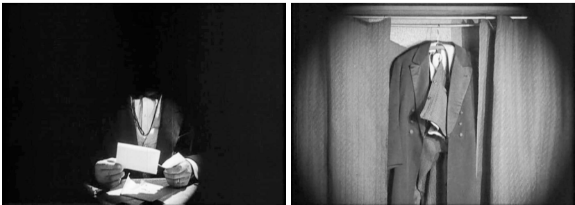
Abb. 14 u. 15 Die Kamera inszeniert eine kopf- und seelenlose Männlichkeit. Screenshot aus LA SOURIANTE MME BEUDET

Die oftmals dem impressionistischen bzw. surrealen Kino zugerechneten Verfahren wie die Doppelbelichtung, die Überblendungen zu den Träumen oder die Großaufnahmen der Gesichter waren allesamt aus dem frühen Film bekannt. Erinnert sein beispielsweise an die frühen facial expression comedies , deren technische Realisierung der Segmentierung und übermenschliche Vergrößerung das Bild zur Attraktion gemacht haben. 27 Ganz Ähnliches gilt für die filmische Attraktion des Traums bzw. der Vision, wenn beispielsweise qua Montage aus dem potenziellen Liebespaar plötzlich unerotische Schlafmützen im ehelichen Bett werden. Diese dem Kino bekannten Verfahren sind von Elena Dagrada überzeugend aufgelistet worden, 28 Blickträger dieser kurzen Filme sind in der Regel jedoch Jungen oder Männer, Dulac stellt diese Verfahren in eine narrative Linearität unter feministischen Vorzeichen.