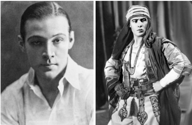
Abb. 19 u. 20 Rodolfo Valentino (Autogrammkarte und Screenshot aus seinem Kassenschlager THE SHEIKH (USA 1921, Melford)

scheinbar ebenfalls in Aufbruchstimmung ist (Abb. 24-26). Sie zeigt sie uns auktorial, aber auch unsere Protagonistin beobachtet sie – wenn auch sehr verhalten. Mit anderen Worten: Die Kamera zeigt queere Menschen und queere Blicke und,