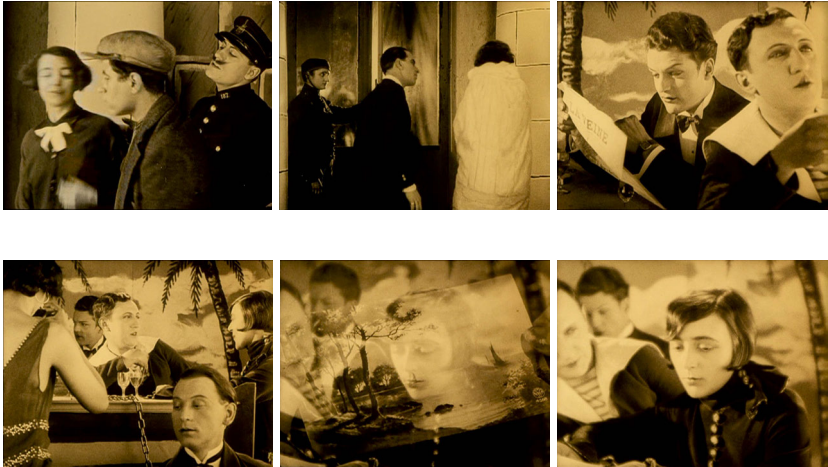
Abb. 21-26 Queere Menschen, queere Blicke. Screenshots L'INVITATION AU VOYAGE.

indem im Film diese Bilder wiederholt festgehalten werden, queert sie m.E. auch die Träume der Protagonistin.