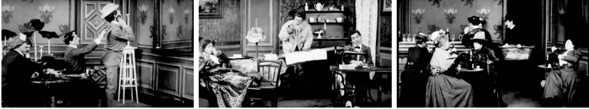
Abb. 1-3 Screenshots aus LES RÉSULTAT DU FÉMINISME (weiblicher Körperstil, Haushalt, Männer im Café)

ihre Macht zurück. 13 Auf der Folie von Judith Butlers Unterscheidung von der affirmativen Parodie zur subversiven Pastiche kann dem Film dennoch ein subversives Potenzial zugeschrieben werden, schließlich offenbart er die »Imitationsstruktur der Geschlechteridentität«, 14 indem er zeigt, dass Weiblichkeit und Männlichkeit Körperstile sind, die mit Machtpositionen einhergehen und die in der Not mit Gewalt zurückerobert werden ›müssen‹.