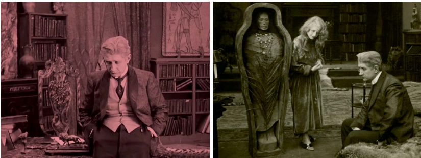
Abb. 4 u. 5 Geschlossene Kadrierungen und die Mumie im Schlafzimmer. Screenshot aus LA CIGARETTE

Der Film beginnt ungewöhnlicher Weise in medias res , der establishing shot mit einer Standkamera zeigt das Museum als Pierres Wirkungsstätte als Ägyptologe und später sehen wir sein Arbeitszimmer; offensichtlich wird, wie sehr der Mitfünfziger in vergangenen Zeiten lebt. Dulac inszeniert die überladenen, holzverkleideten Räume mit geschlossenen Kadrierungen – ein Außerhalb existiert quasi nicht (Abb. 4). In dieser ersten Szene wird zwischen den antiken Statuen die Mumie einer Prinzessin ins Museum gebracht. Die ägyptische Prinzessin wird von Pierre in einer seiner Studien explizit als zu lebenslustig, zu flirtend und zu frivol charakterisiert, so dass sie ihren viel älteren Ehemann einst zur Verzweiflung trieb, der sich infolgedessen mit einem vergifteten Kuchen das Leben nahm. Für gewisse Zeit wird die Mumie zur ›Partnerin‹ Pierres, da er sie direkt mit ins Schlafzimmer nimmt. In dem Spiel mit dem Tod liegt nicht zuletzt die morbide Komik des Films wie sie narrativ aber auch visuell durch die physische Nähe der beiden Frauen dargestellt wird hervorgebracht wird (Abb. 5).