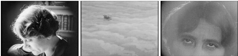
Abb. 9-11 Die subjektive Kamera – Mme Beudets Tagträume. Screenshot aus LA SOURIANTE MME BEUDET

Kurz vor der Mitte des Films – inszeniert sozusagen als Höhepunkt bürgerlicher Dumpfheit – liest Mme Beudet das Gedicht La Mort des amants aus den Fleurs du Mal (1857) von Charles Baudelaire. Die Zuschauer*innen lesen mit ihr die ersten Verse: »Nous aurons des lits pleins d'odeurs légères,/Des divans profonds comme des tombeaux,/Et d'étranges fleurs sur des étagères«. Das Pathos Baudelaires wird in LA SOURIANTE MME BEUDET Vers für Vers mit statischen Einstellungen aus ihrem Haushalt banalisiert. Mit den jeweils eingblendeten Versen interagiert ein unbenutztes Bett, zwei hübsch arrangierte Kissen im Sessel und die von den Eheleuten immer wieder auf den vermeintlich richtigen Platz geschobene Vase mit künstlichen Blumen. Am Ende wirft Mme Beudet resigniert das Buch zu Boden. Offensichtlich ist auch ein anderer Prätext, nämlich Flauberts bürgerliche Epopöe Madame Bovary. Mœurs de Province (1856), der schon mit der erste Zwischentafel (»En province«) markiert wird. 26 Der bovarysme der Mme Beudet wird allerdings nicht durch romantische Literatur ausgelöst, sondern durch eine Illustrierte, ein augenzwinkernder Hinweis auf die wachsende Bedeutung dieses Mediums in den 1920er Jahren und auch darauf, dass die Protagonistin als moderne Frau zu verstehen sei, die als mediales Idealbild eben in diesen Illustrierten und anderen visuellen Medien gezeigt wird.