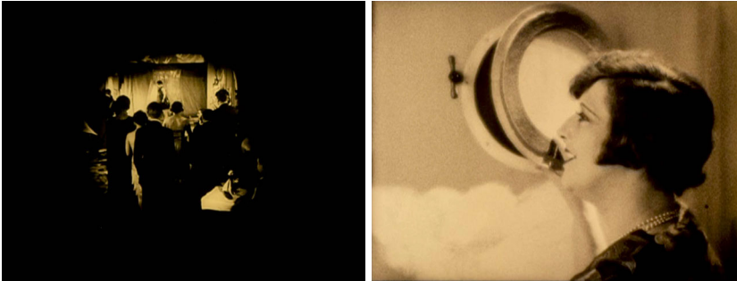
Abb. 16 u. 17 Die Kreisblende und andere Ausblicke öffnen den Blick in verheißungsvolle Welten. Screenshot aus L'INVITATION AU VOYAGE

genderte Schaulust. So schaut die Frau in der Bar durch ein Bullauge, das in der Wand eingelassen ist (Abb. 17). Sie sieht das Meer, einen leidenschaftlichen Liebhaber und die Wolken als Inbegriff des Fernwehs. Diese Traumbilder werden in Variationen regelmäßig montiert und rhythmisieren den Film. Untergeordnet ist der Traum des schmachtenden Seemanns: Er blickt ebenfalls durch das Bullauge, doch vermag er zunächst nicht zu träumen (die Kamera zeigt uns einen unaufgeräumten Hinterhof). Später sehen wir zunächst mit Blick auf ihn – im Wechsel mit den romantischen Träumen der Frau – einen sexualisierten Traum. Wie erigerte Penisse ploppen Segelschiffe am Horizont auf, dann zeigt sich ein nackter Frauentorso. Die Montage führt vor, dass die beiden selbst in ihren Wünschen und Träumen nicht wirklich zusammenkommen. Dass der ersehnte Ausbruch aus der Ehe in L'INVITATION AU VOYAGE an der bürgerlichen Moral des potenziellen Liebhabers scheitert, potenziert Dulacs kritische Haltung zur bürgerlichen Moral.