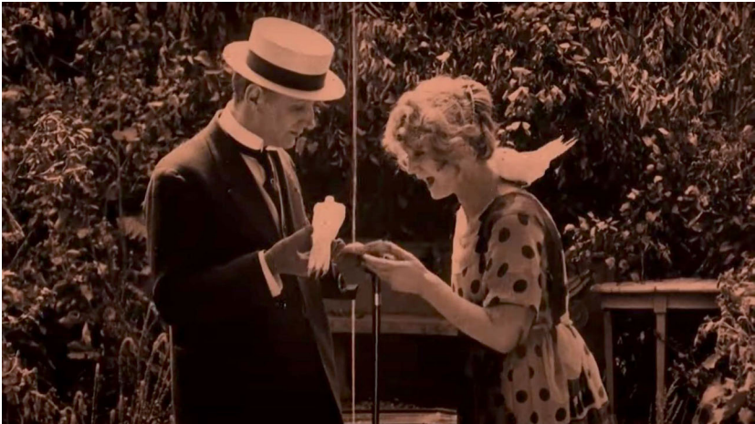
Abb. 8 Gegensatz im Bild. Screenshot aus LA CIGARETTE.

so kein männlich hegemonialer, abtastender Blick à la klassisches Hollywoodkino, die Kamera schaut vielmehr näher hin und bewegt sich auf Augenhöhe mit einer selbstbewussten Frau; alles andere wird im wahrsten Sinne des Wortes ausgeblendet (Abb. 7). Dulac arbeitet hier mit einer nicht zentrierten Kreisblende. Das rechteckige Filmbild wird auf einen kreisförmigen Ausschnitt verengt, als würden wir uns dem Dargestellten beispielsweise mit einem Teleskop nähern, um Nicht-Sichtbares sichtbar zu machen. Die Kreisblende dient dazu, Blicke in ›andere Welten‹ zu ermöglichen, so konnte das technische Wunderwerk des Films und die