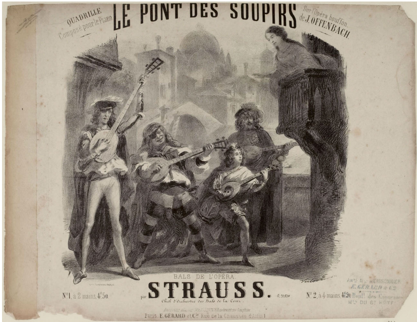
Abb. 1 Die Karikatur einer ›Serenade‹ in Offenbachs Le pont des soupirs : Catarina Cornarini und ihre vier Verehrer, unter ihnen ihr Ehemann

Ständchen und lässt Amoroso zum Entsetzen Catarinas festnehmen. Diese dreifach wiederholte Barkarole stellt Cornarino Cornarini bei seiner Rückkehr 50 , passend zu seinem sprechenden Namen, als einen doppelt ›gehörnten‹ Ehemann vor und mündet musikalisch in der komischen Überlappung der drei Barkarolen im Gesangsensemble. 51