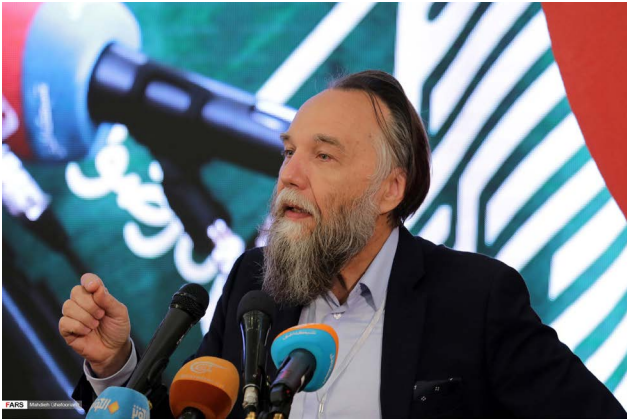
Alexander Dugin 2018 in Teheran

Eine vollständige Darstellung von Dugins Ideenvielfalt ist schwieriger als bei Gumiljows Geschichtsspekulationen. 27 Der Großteil von Gumiljows Werken dient der historischen Illustration seiner semibiologischen Ethnogenesetheorie. Dugins Werk hingegen trägt postmoderne Züge und zeichnet sich durch theoretische Beliebigkeit sowie programmatische Offenheit aus.