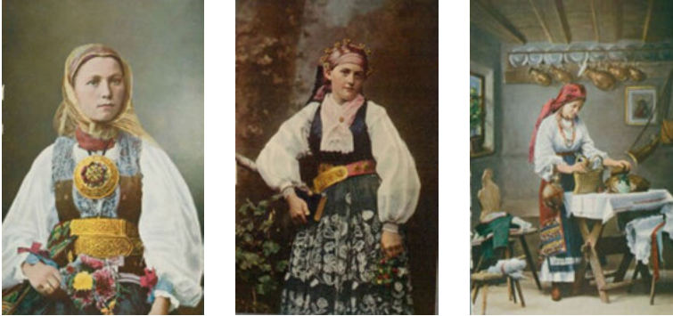
ABBILDUNGEN 4-6: CSÁNGO-FRAU; SÄCHSISCHE JUNGE FRAU, GEBOCKELT 109 UND GESCHMÜCKT; RUMÄNISCHES MÄDCHEN. IN: DIE KARPATHEN 14 (1909), o.S.

Unter den zahlreichen Bauernfotos befinden sich sowohl einzelne Porträts als auch Gruppenbilder. Junge, Alte, Kinder, Frauen, Männer usw. sind oft in Trachten dargestellt, was hervorragend zu dem immer wieder betonten ethnologischen Schwerpunkt der Zeitschrift passt (Abbildungen 4-6).