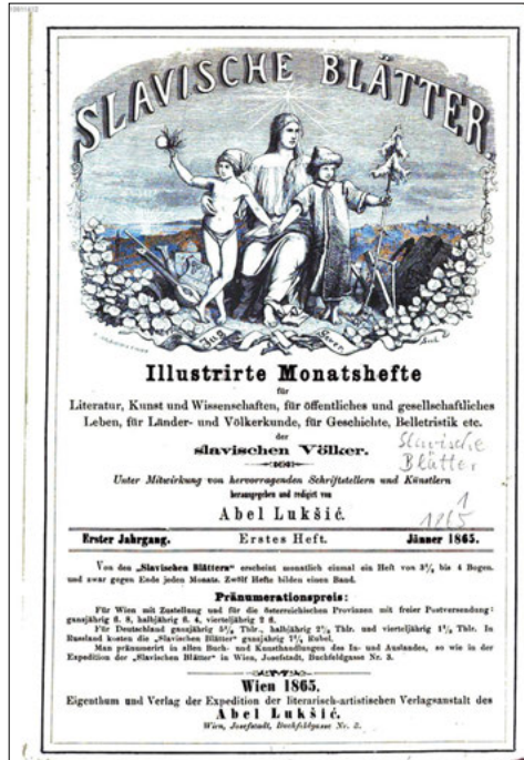
ABBILDUNG 1: TITELSEITE, Jg. 1

geistige Thätigkeit im ganzen Südslaventhume«. 16 Dementsprechend ist auf der Titelseite der Zeitschrift die allegorische »Mutter Slavia« bei Morgenröte abgebildet, zwei Söhne umarmend, welche Symbole des Südens und Nordens in ihren Händen tragen. Am unteren Rand steht in kroatischer Sprache »Süden« (Jug) und »Norden« (Sever) geschrieben (s. Abbildung).