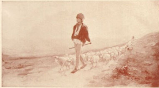
ABBILDUNG 2: NIK. JOH. GRIGORESCU: IM FRÜHLING. IN: DIE KARPATHEN 16 (1908), o.S.

Kirche dar. 104 Auch aus der neuen Hermannstädter orthodoxen Kathedrale sind Malereien reproduziert, die Notiz dazu weist auf die rumänischen Motive in den byzantinischen Malereien hin. Zugleich folgt dem Bild die Bemerkung, dass die Farben stellenweise nicht harmonisieren, »ein Beweis, daß nur ein geborener Rumäne hier überall mit seinem Empfinden das für den rumänischen Geschmack Richtige hätte treffen können«. 105