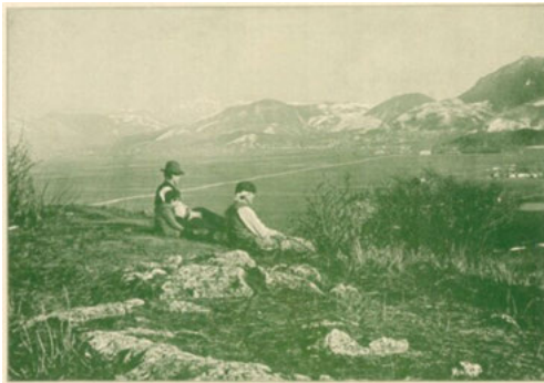
ABBILDUNG 3: DIE SIEBENDÖRFER AM FUSSE DER BERGE. IN: DIE KARPATHEN 4 (1907), o.S.

Das »Mioritische« ist durch Nikolaus Johannes Grigorescus Bilder vertreten, die als idyllische Darstellungen schon damals bekannt waren und die die »Poesie und Melancholie« der Heimat vor Augen führen (Abbildung 2). 106 Im Unterschied zur textuellen Präsenz ist das Rumänentum visuell intensiver vertreten.