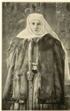
ABBILDUNG 1: FRIEDRICH MIESS: RUMÄNIN AUF DEM KIRCHGANG. IN: DIE KARPATHEN 2 (1907), o.S.

Jährlich sind in der Zeitschrift 50 Bilder zu finden, die beinahe ausschließlich Heimatkunst und -kunde repräsentieren. Aus der Perspektive der Identitäts- und Alteritätskonstruktionen sind die Darstellungen von Landschaften, Trachten, Bauern und sächsischen Städten besonders relevant, da sie die Texte oder thematische Schwerpunkte visuell ergänzen.