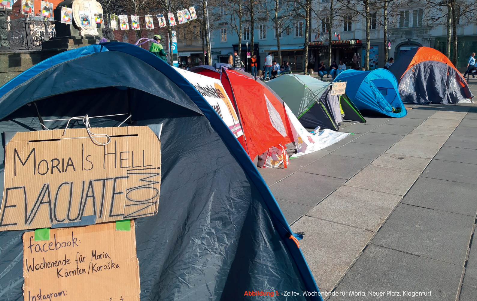
Abbildung 1: »Zelte«. Wochenende für Moria, Neuer Platz, Klagenfurt

Von Caroline Schmitt mit Rap-Texten von Mighty M. aka Himmeldach