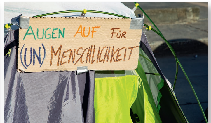
Abbildung 2: »Alle Lager evakuieren! Menschen aufnehmen! Abschiebungen stoppen!«, Wochenende für Moria, Stadttheater Klagenfurt