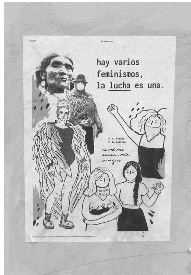
Imagen 2. Afiche alusivo a Dolores Cacuango. Marcha del 8 de marzo de 2020 en Quito, Ecuador