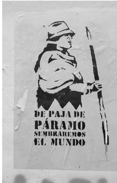
Imagen 1. Esténcil alusivo a Dolores Cacuango. Marcha del 8 de marzo de 2020 en Quito, Ecuador