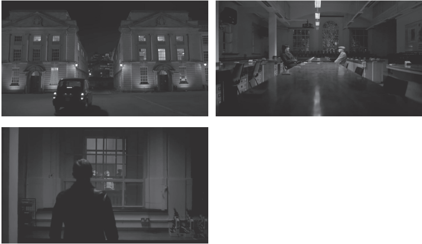
Abb. 3–5: Filmische Visualisierung von (falschen) Entscheidungen (TC 01:07:27, 01:09:41 und 01:19:51).

der Ereignisse durch eine unvorhersehbare Handlung aufbricht, entlarvt er für das Publikum das Streben nach der lückenlosen Erkenntnis und der Unabhängigkeit vom Zufall als unproduktiven Ego-Trip.