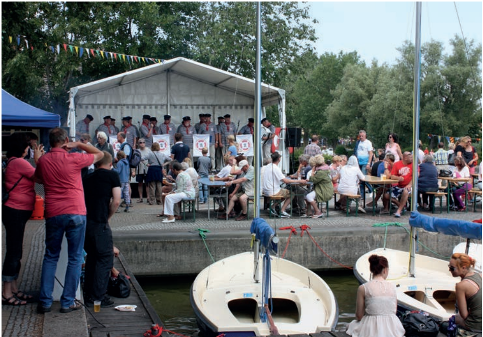
Abb. 13 Wustrow, Hafenfest zur »Kleinen Fischländer Wettfahrt« mit inzwischen fest-typischer Unterhaltung durch einen Shanty-Chor, Juli 2015.