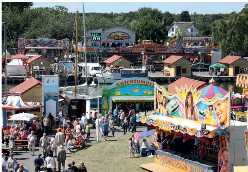
Abb. 9 Freest, Fischerfest, August 2015.