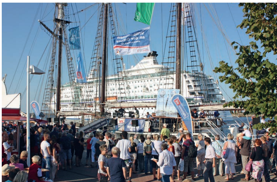
Abb. 7 Warnemünde, »Port Party« zur Verabschiedung des norwegischen Kreuzfahrtschiffes BIRKA, August 2015.