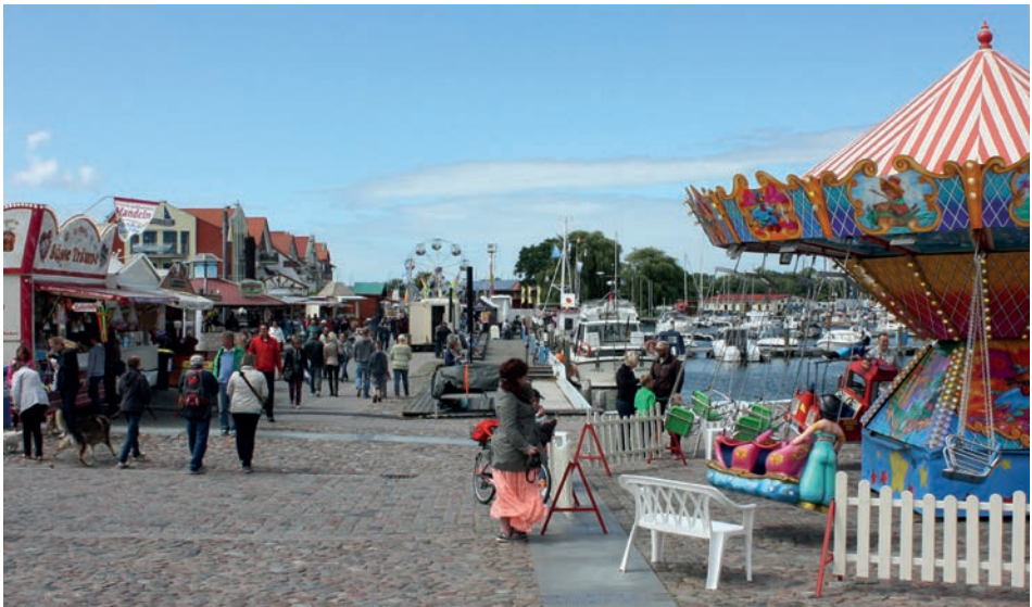
Abb. 2 Barth, Hafenfest, Juli 2015.