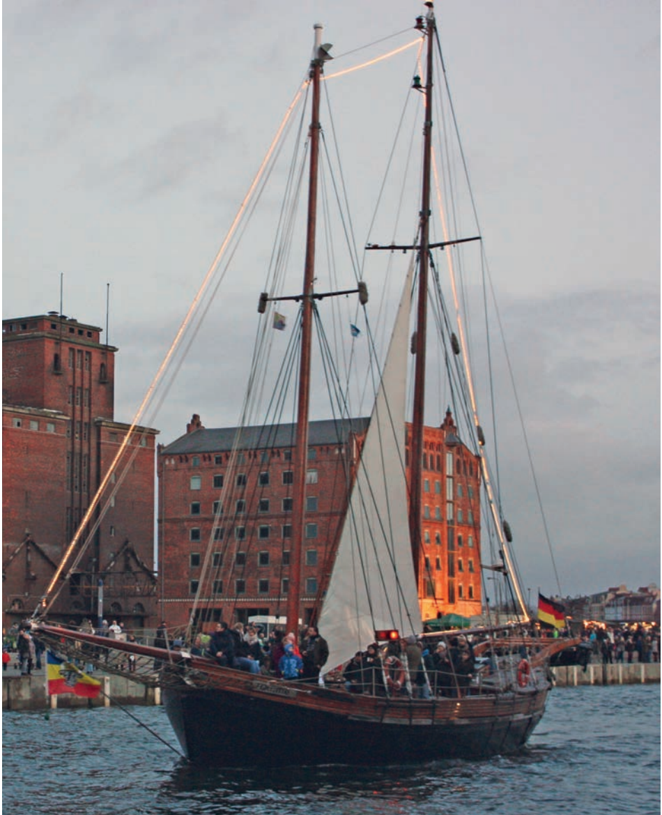
Abb. 15 Wismar, »Lichterfahrt«, Dezember 2016.