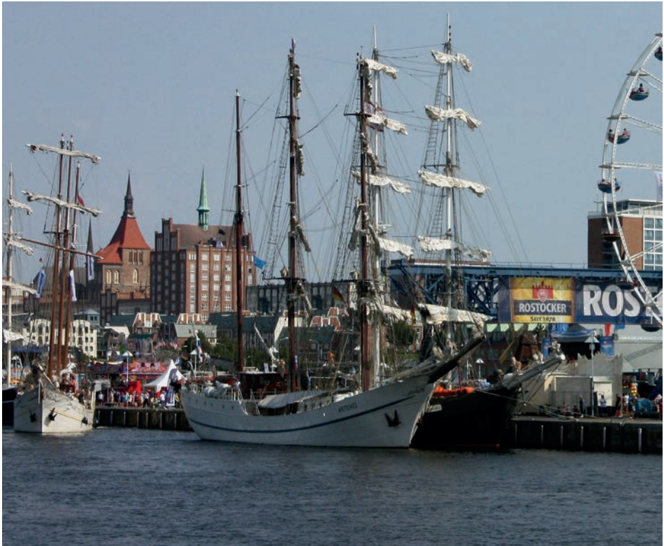
Abb. 1 Rostock, Hanse Sail, August 2018.