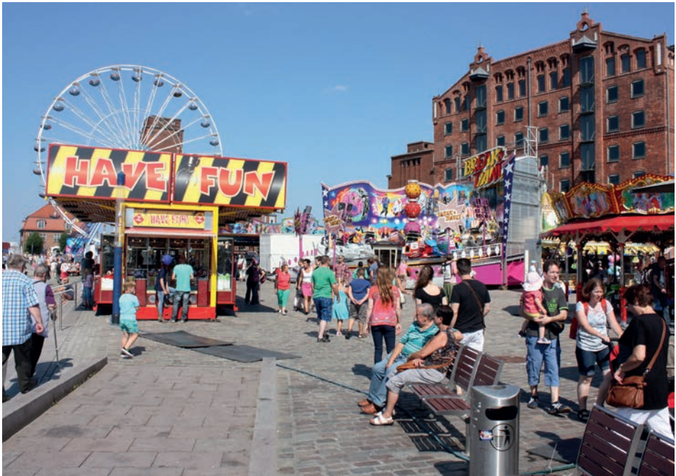
Abb. 4 Wismar, Stadthafen während des Schwedenfestes, August 2015.