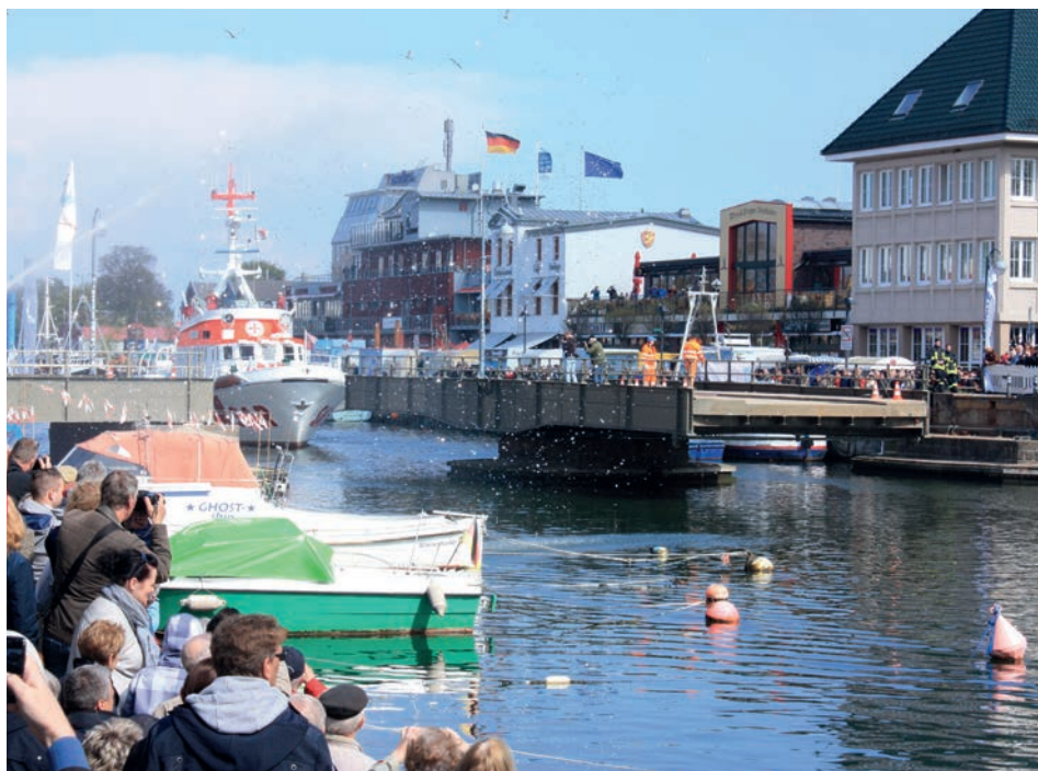
Abb. 6 Warnemünde, »Stromerwachen« mit Brückendrehung zur Saisonöffnung, Mai 2015.