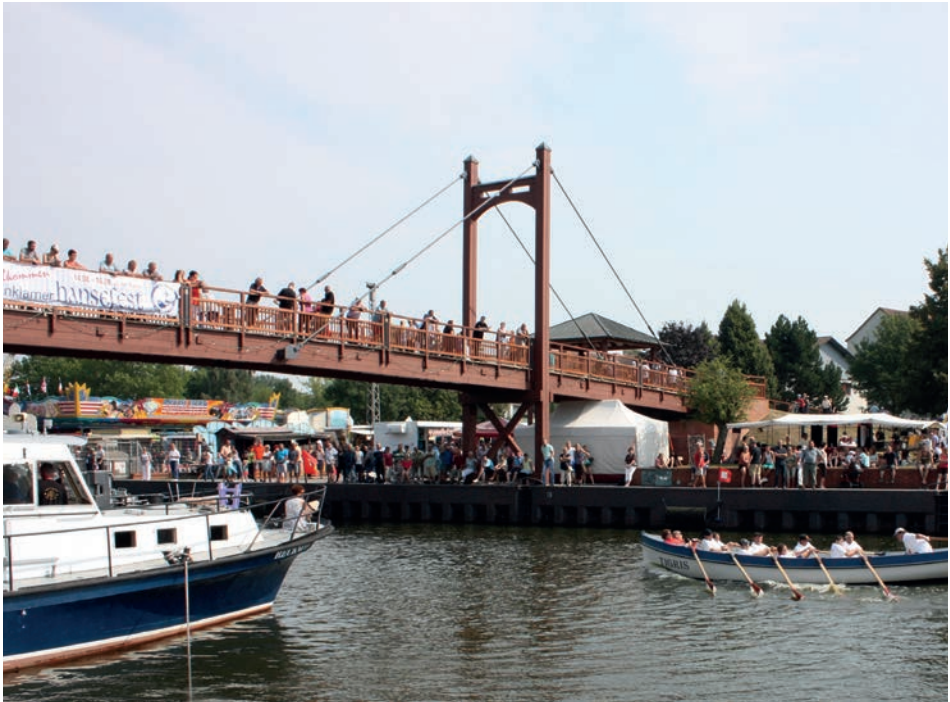
Abb. 3 Anklam, Hansefest, August 2015.