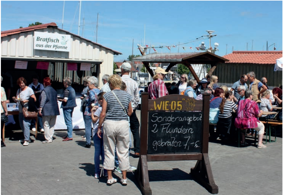
Abb. 12 Greifswald-Wieck, Fischerfest mit Beteiligung von Fischern, Juli 2016.