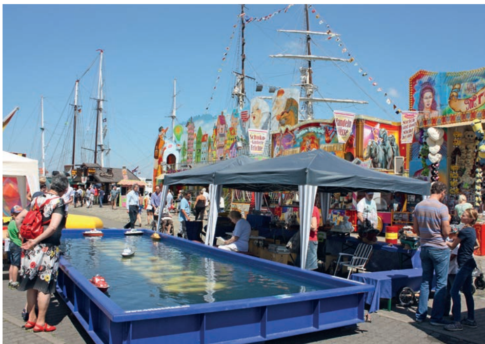
Abb. 5 Stralsund, Hafenfest, Juni 2016.

kleines Seefahrer- und Fischerdorf vor den Toren Rostocks – bereits 1323 von der Hansestadt aus landesherrlichem Besitz käuflich erworben wurde. Deshalb werden die maritimen Volksfeste in Warnemünde, genauer zunächst die sommerlichen Veranstaltungen, aber noch nicht die weiter unten thematisierten Fisch-Feste und »saisonverlängernden Wintervergnügen«, an dieser Stelle genannt. Der allgemeinen Volksfesttendenz entsprechend, folgten auch in diesem Seebad dem großen Sommerfest, der »Warnemünder Woche« und der Beteiligung an der »Hanse Sail« bald nach 1990 weitere mehrtägige Veranstaltungen entlang des Alten Stroms: Seit 1994 beendet ein »Stromfest« Anfang September die Hauptsaison, und seit 1995 wird mit dem »Stromerwachen« Anfang Mai die Sommersaison eröffnet. Außerdem finden seit 2006 alljährlich mehrere »Port Partys« mit Livemusik, Schlep-perballett und Höhenfeuerwerk statt, und zwar zur abendlichen Verabschiedung auslaufender Kreuzfahrtschiffe, die während der Saison Warnemünde ansteuern. In der am gegenüberliegenden Ufer 2004 eröffneten Yachthafen-residenz Hohe Düne fand das erste Hafenfest erst 2012 statt. Es wird seither jeweils zur Mittsommerwende veranstaltet.