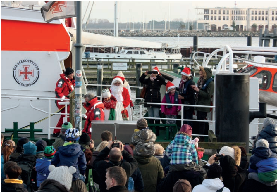
Abb. 14 Warnemünde, Ankunft des Weihnachtsmannes mit dem Seenotkreuzer ARKONA, 24. Dezember 2015.