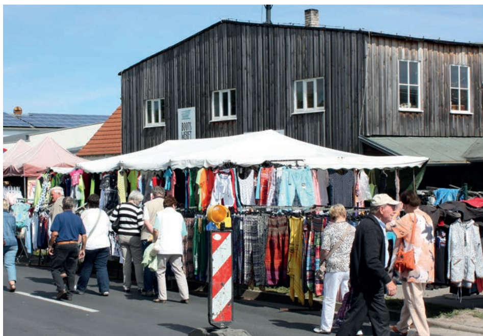
Abb. 10 Freest, eine »Händlermeile«, wie sie neuerdings auf allen Hafenfesten anzutreffen ist, August 2015.