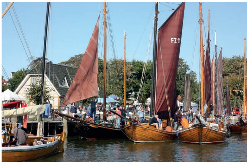
Abb. 8 Althagen, Hafenfest zur Althäger Fischerregatta, September 2017.

ren Boote (Netzboote, Heuer) zeugt. Das gilt ebenso für die von der Poeler Bootswerft in Kirchdorf veranstaltete Wettfahrt »Alte Boote unter Segeln«, die es seit 1997 gibt, die aber ohne Hafenfest stattfindet. In Breege wird seit 1998 die »Breeger Saalhund-Regatta« ausgetragen, in den ersten Jahren noch als eigenständige Veranstaltung mit einem kleineren Rahmenprogramm im Hafen. Auch in Lauterbach, dem Heimathafen des »Fürstlichen Yacht-Clubs Puttbus«, wird das Hafenfest seit 2005 (wieder) von Segelveranstaltungen (u.a. Regatta »Rund Vilm«, Goor-Cup) begleitet. Als jüngste ländliche Segelveranstaltung ist die »Usedom Sail« zu nennen, die 2013 als »maritime Event-Messe« in Zinnowitz ins Leben gerufen und 2015 und 2016 in Krummin als kleine Regatta vor dem Hafen zusammen mit einem Hafenfest durchgeführt wurde.