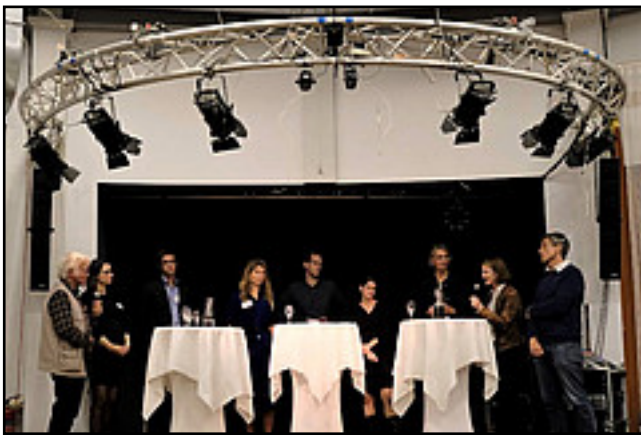
Bei der Abschlussdiskussion im Paradiescafé

Im Verlauf der beiden Konferenztage zeigten sich die Ambitionen des SFBs wie auch der Tagung – und wie viel sich davon realistisch umsetzen ließ. Das Anliegen, das eigene Thema über möglichst viele prominente Referent:innen sichtbar zu machen, kollidierte mit der straffen Zeitplanung ebenso wie mit den Schwierigkeiten der Logistik zwischen Jena, Chicago, Berlin und New York. Die zahlreichen Unterthemen und Teilprojekte machten viele Panels erforderlich, zwischen denen es mal leichter, mal schwerer fiel, Verbindungslinien zu ziehen. Das Ziel, eine möglichst globale Perspektive durch viele internationale Stimmen zu eröffnen, wurde durch deren Abwesenheit nach den Videoschalten konterkariert, wenn in den Konferenzpausen vorwiegend auf Deutsch diskutiert wurde. Der Wunsch nach theoretischem Tiefgang stand schließlich in Kontrast zum Anspruch öffentlicher und öffentlichkeitswirksamer Soziologie – entsprechend deutlich blieb auch der Bruch zwischen den beiden Veranstaltungsorten in der Jenaer Aula und dem Paradiescafé am anderen Ende der Innenstadt, den beiden Konferenzsprachen sowie den Zuschnitten der Hauptveranstaltung und der öffentlichen Abschlussdiskussion.