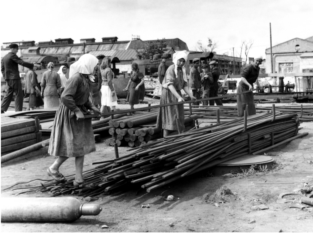
Ukrainische Frauen bei der Zwangsarbeit im Reichsbahnausbesserungswerk (RAW) in Kiew, 1943