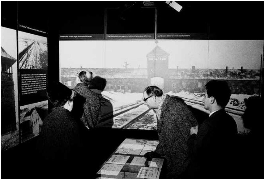
Abb. 2: An der Erarbeitung und Präsentation der Ende 1964 in der Frankfurter Paulskirche gezeigten, viel beachteten Ausstellung Auschwitz – Bilder und Dokumente hatten ehemalige Häftlinge wesentlichen Anteil.