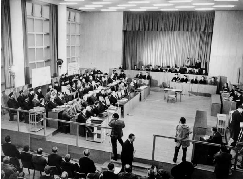
Abb. 1: Erster Frankfurter Auschwitz-Prozess. Blick von der Pressetribüne in den Gerichtssaal im umgebauten Bürgerhaus Haus Gallus. Links die Angeklagten mit ihren Verteidigern.

wiedergeben sollten; ihre Aussagen seien oft widersprüchlich, es käme zu Projektionen, Verwechslungen und Übertreibungen, ungeachtet der Fälle, in denen Belastungen aus politischen Gründen oder wegen persönlicher Ressentiments ausgesprochen würden. All das zu prüfen, sei für die Gerichte eine enorme Herausforderung. Mit Hofmeyers Beitrag wurde erstmals der zwar verständnisvolle, aber zutiefst skeptische Blick der Justiz auf die gesamte Zeugengruppe der NS-Verfolgten öffentlich ausgeführt. Die Zeugen aus den Reihen der SS wurden dagegen bei Hofmeyer gar nicht benannt, als seien ihre Aussagen nicht einmal eine Erwähnung wert.