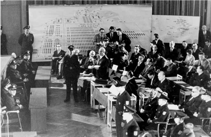
Abb. 4: Erster Frankfurter Auschwitz-Prozess, Prozesseröffnung im Frankfurter Römer, 20. Dezember 1963.