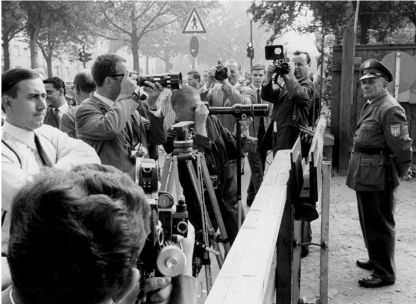
Abb. 7: Presse vor dem Haus Gallus in Frankfurt am Main, vermutlich anlässlich der Urteilsverkündung am 19./20. August 1965.

zurecht den Eindruck haben, nicht nur zu den Prozessbeteiligten zu sprechen, sondern zu einer internationalen Öffentlichkeit. Was für eine völlig neue Möglichkeit! Die Publizität des Verfahrens sorgte ihrerseits für weitere Zeugenmeldungen, etwa aus den Vereinigten Staaten. Zeugen aus Osteuropa konnten erstmals zu einem Publikum jenseits des Eisernen Vorhangs sprechen; das Bewusstsein davon hört man den Aussagen mancher polnischen oder sowjetischen Häftlinge durchaus an. Es ging nicht allein um Aussagen über einzelne Täter oder die eigenen Verfolgungserfahrungen, sondern auch um Repräsentation der eigenen Gruppe oder gar Nation. An etlichen Beispielen, wie etwa dem von Maryla Rosenthal, wird deutlich, dass die ehemaligen Häftlinge das Gerichtsverfahren auch als Forum nutzten, um mit ihren Mithäftlingen zu kommunizieren, die nun in aller Welt verstreut lebten. Es ging dabei um die Rechtfertigung des eigenen Verhaltens im Lager oder auch um die eigenen Interpretationen und Narrative der Lagergeschichte. Das zeigt sich beispielsweise in den Aussagen mehrerer polnischer Funktionshäftlinge, die sich bemühten, der Öffentlichkeit ein vom antifaschistischen Universalismus geprägtes und auf den Lagerwiderstand fokussiertes Bild von Auschwitz zu vermitteln.