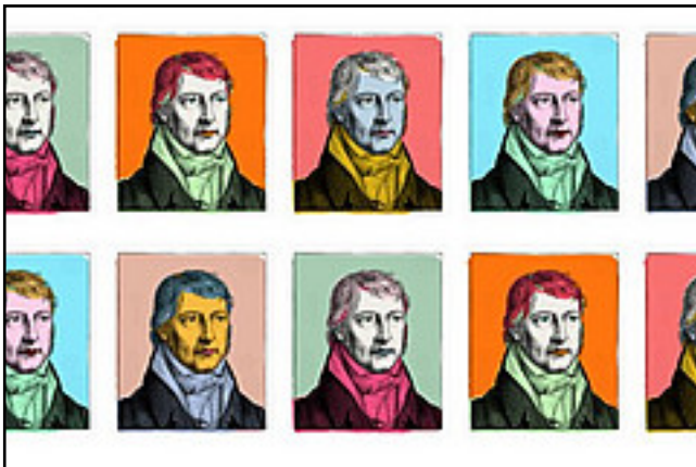
G.W.F. Hegel , Kupferstich-Kabinett, Staatliche Kunstsammlungen Dresden