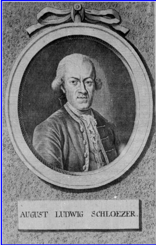
AUGUST LUDWIG SCHLOEZER.