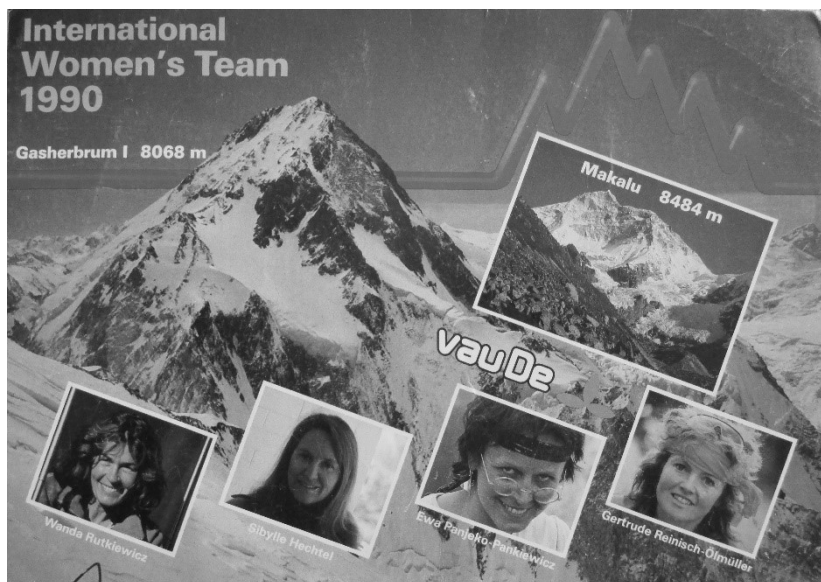
Abb. 12: Grußpostkarte des International Women's Team Gasherbrum I