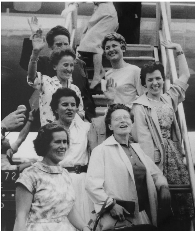
Abb. 6: Das Team der Expédition féminine au Cho Oyu auf der Gangway

Das restliche Team brach am 12. August 1959 in Paris auf. Wiederum in Anwesenheit zahlreicher Journalist:innen winkten sieben adrett gekleidete Frauen am Flughafen zum Abschied in die Kameras.