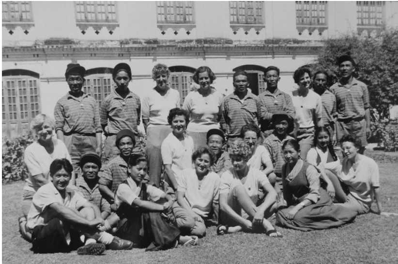
Abb. 7: Gruppenfoto im Garten der indischen Botschaft in Kathmandu

ground as they did in their own temples, and remarkable that living on a pedestal had not spoiled his simplicity and modesty.« 67