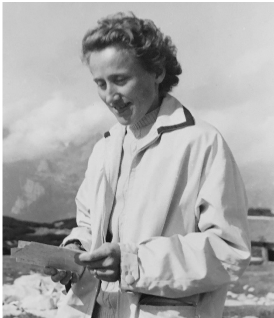
Abb. 5: Claude Kogan in den Alpen, ca. 1955

gungsversuch. 11 Kogan erreichte dabei gemeinsam mit Lambert eine Höhe von 7.730 Metern, bevor die beiden den Gipfelversuch aufgrund von Stürmen abbrechen mussten. 12 In Frankreich wurde Kogan daraufhin als »la femme la plus haute du monde« bekannt. 13