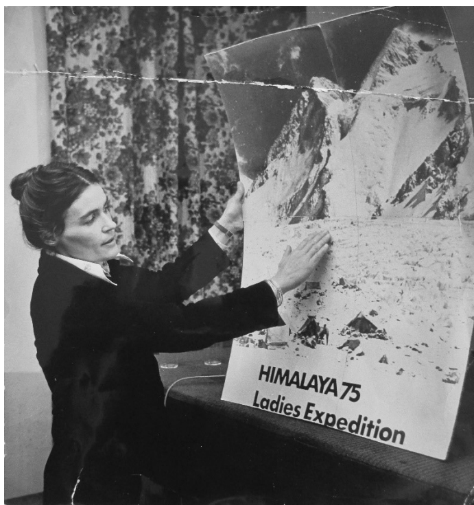
Abb. 10: Wanda Rutkiewicz bei einer Präsentation der ersten polnischen Frauenexpedition 1975

nahme an einer anderen Expedition zu warten. Die Frauenexpedition war gleichzeitig die Erfüllung meiner Sehnsucht nach einer unabhängigen Expedition.« 132