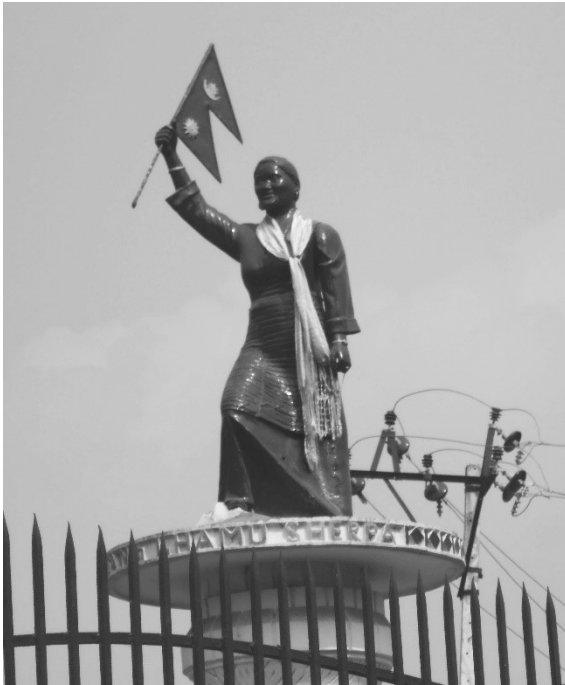
Abb. 16: Statue von Pasang Lhamu Sherpa in Kathmandu

Bouddha (mit einer weithin sichtbaren Statue), ein Berg, ein Highwayabschnitt, eine Getreidesorte und eine Gedenkhalle benannt. 72