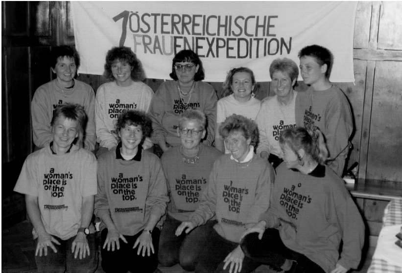
Abb. 13: Gruppenbild der Wanda Rutkiewicz' Gedächtnisexpedition, Wien 1993