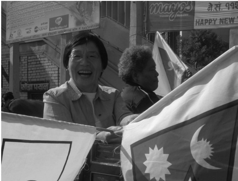
Abb. 9: Junko Tabei (li.) und Phantog (re.) 2005 in Kathmandu bei der Parade zum 30-jährigen Jubiläum ihrer Frauenerstbesteigung des Mount Everest

revolution« stilisiert: »The first ascent of the peak from the north by a Chinese woman climber in particular has brought into relief the invincible revolutionary spirit of Chinese woman.« 194 Phantog bekam in der Folge eine Anstellung im Sportministerium, war chinesische Delegierte bei der Weltfrauenkonferenz in Peking 1995 und fungierte 2008 als Flaggenträgerin bei den Olympischen Spielen in Peking. 195 Trotz dieser öffentlichen Anerkennung, die die Mount-Everest- beziehungsweise Chomolungma-Besteigung (tibetisch) der Chinesin in China bescherte, genoss sie weit weniger weltweite Popularität als die Japanerin Tabei.