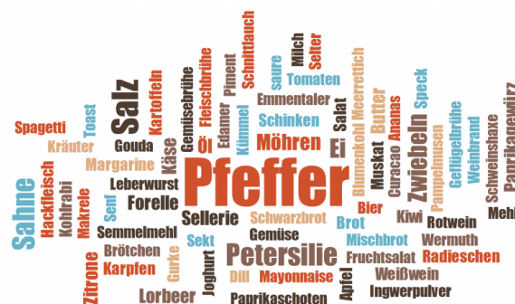
Abbildung 3. Wortwolke der verwendeten Lebensmittel in den ausgewählten HAPS Folgen (n = 138).

Blickt man allerdings auf die Häufigkeitsverteilung der Lebensmittelgruppen in den untersuchten Folgen und die Aufschlüsselung der konkret verwendeten 138 Nahrungsmittel in Form einer Wortwolke (siehe Abbildung 3), erhält man einen detaillierteren Einblick in die hier vermittelte Lebensmittelstruktur.