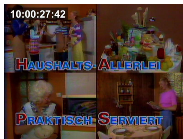
Abbildung 1. Splitscreen Image aus HAPS Intro.

Die Sendereihe richtete sich dabei explizit an Zuschauer*innen im Alter zwischen 20 und 50 Jahren. Als besondere Zielgruppe galten junge Ehepaare, auf die man glaubte, nachhaltig einwirken zu können, da sie als weitgehend unbedarft in Küche und Haushalt galten. 11 Diese Zielgruppe sowie ältere Bürger*innen wurden über die Visualisierung des Intros direkt zu Beginn der Sendereihe angesprochen (siehe Abbildung 1).