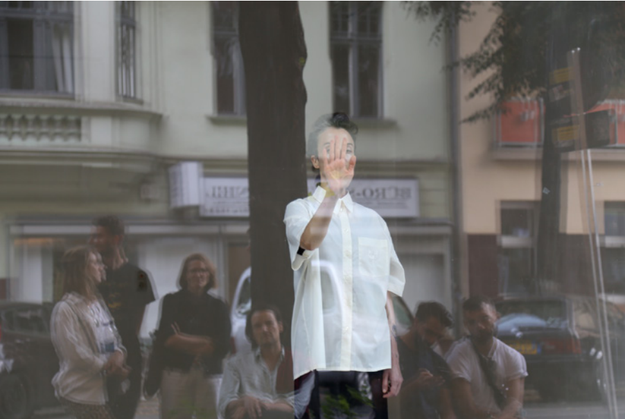
Leman Seveda Daricioğlu: "Aramızda Okyanuslar" performansından fotoğraf, Apartman Projesi, Berlin, 2020

Sahadaki artan dijitalleşme, fiziksel birliklerin kısıtlanması ve etkinlik iptallerinin getirdiği olumsuz etkileri dengelerken hem erişilebilirliğin kapsamını arttırdı hem de ekonomik ve idari yükleri hafifletti. Buna karşılık, özellikle festival, sergi ve topluluk inşa aktiviteleri gibi daha önceden fiziksel olan etkinliklerin çevrimiçi formatlara aktarılmasındaki sıkıntılardan ötürü, dijital yorgunluk ve yabancılaşma, katılımcıların paylaştığı bir deneyim olarak öne çıktı. Son olarak, Covid'in var olan sistemlerdeki yetersizlik ve kırılma noktaları gün yüzüne çıkarması ile birlikte dayanışma, özellikle bağımsız, muhalif veya eleştirel sanatçı ve sanat kurumlarının varlıklarını sürdürebilmelerine yönelik temel kavram haline geldi.