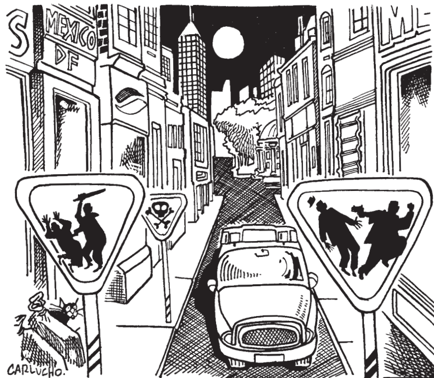
Carlos Villar Aléman (Carlucho)

Das Gesetz zur Reform des Bildungswesens setzt dort an. Über bilingualen Unterricht, wie er in einigen von Indigenen und Mestizen bewohnten Agrarkolonisationen praktiziert wird 3 , soll die interkulturelle Kommunikationsfähigkeit verbessert werden, um zur