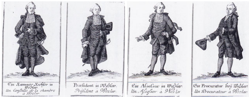
Abb. 6.1 Amtskleidung des RKG-Personals spätes 18. Jahrhundert

Quelle Johann Martin Will (1727–1806); Kupferstiche