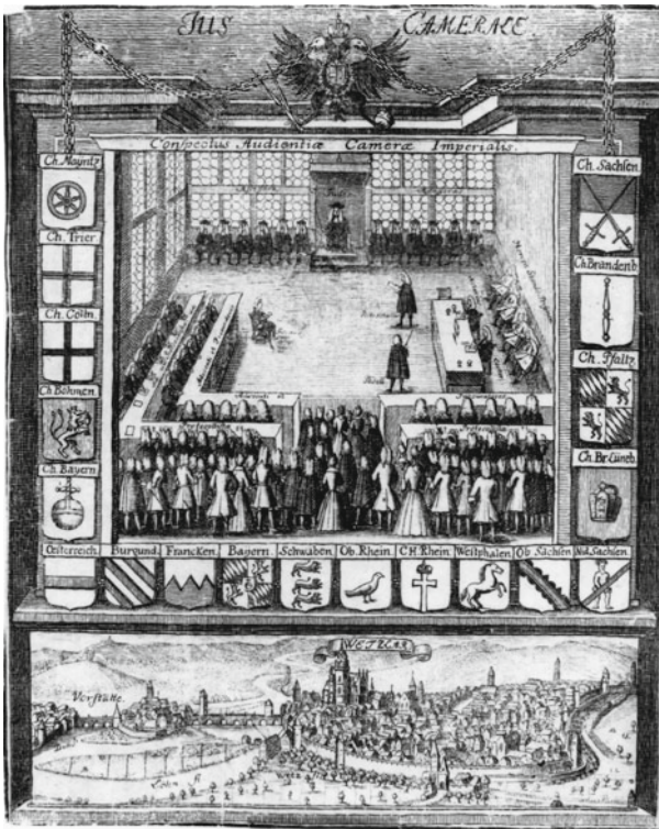
Abb. 6.3 Darstellung der Audienz am RKG 1735

Quelle Peter Fehr; Kupferstich: um 1735, 18,9 × 15,1 cm