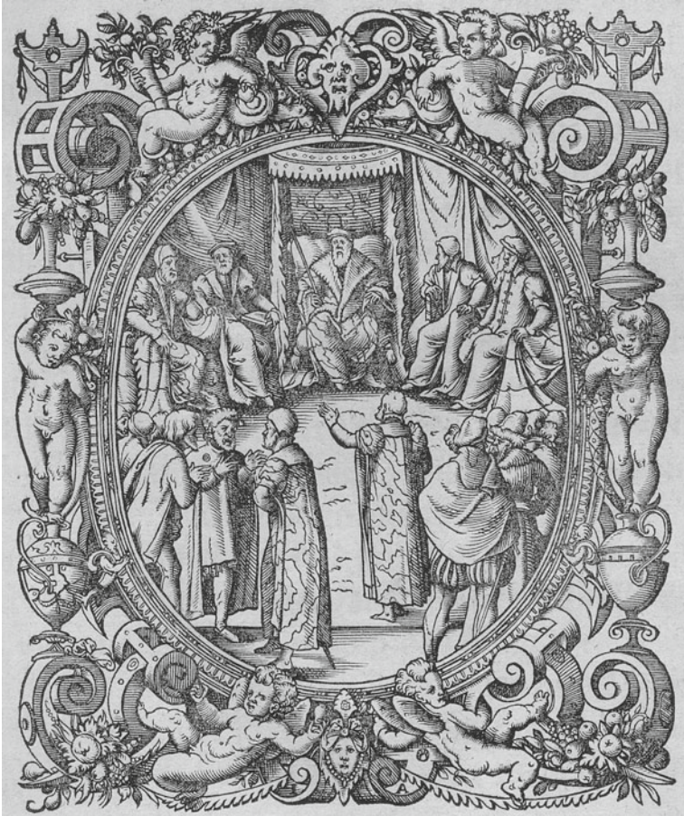
Abb. 6.2 Darstellung der Audienz am RKG 1566

Quelle Titelvignette aus Noe Meurer, Cammergerichts Ordnung und Proceß: neben allerley desselben Formen und Exemplarn [...], Frankfurt a. M. 1566; Kupferstich