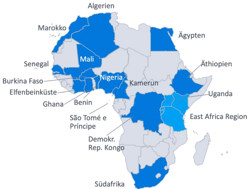
Abb. 2: Länder auf dem afrikanischen Kontinent, in denen aktuell aktive Biennalen stattfinden

Die folgende Überblicksdarstellung und Einordnung der Biennalen für zeitgenössische Kunst des afrikanischen Kontinents anhand geographischer Zonen folgt der Definition der Regionen Afrikas der AU. 9