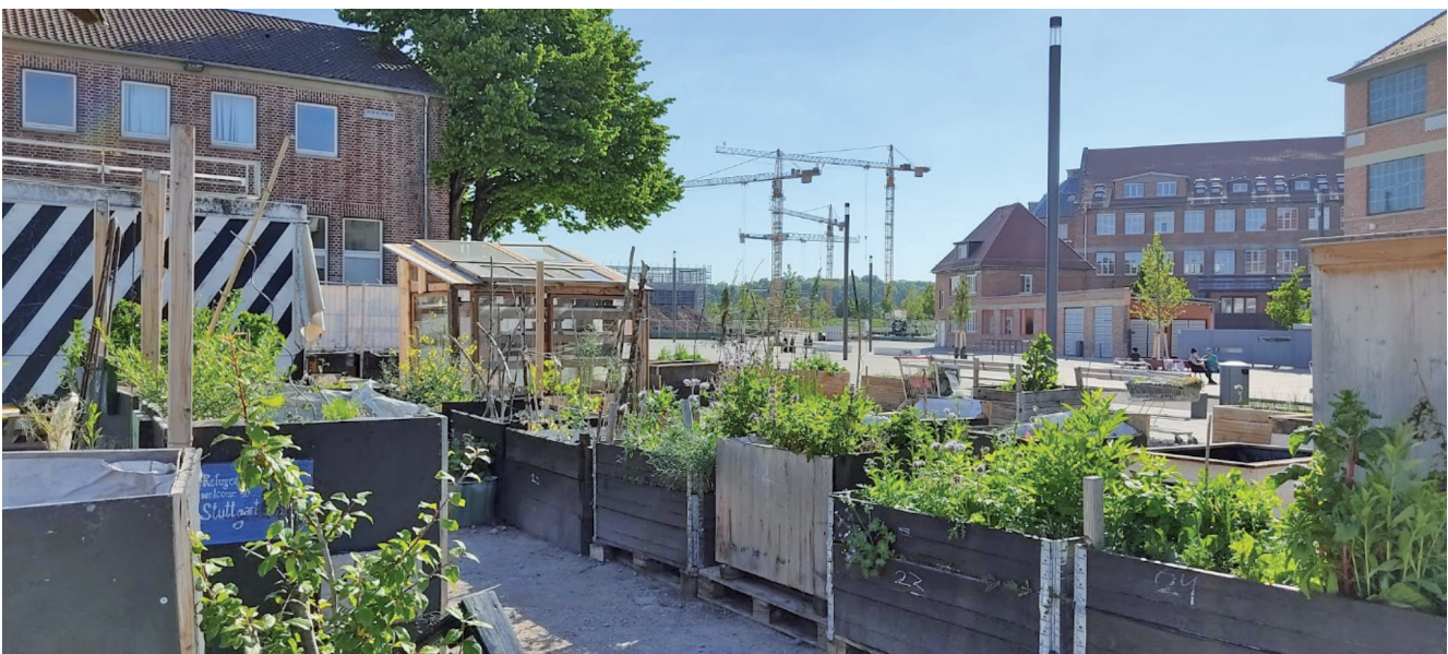
Abb. 2: Reallabor inselgrün: Mobiles Gärtnern mitten in der Baustelle „Neckarpark“