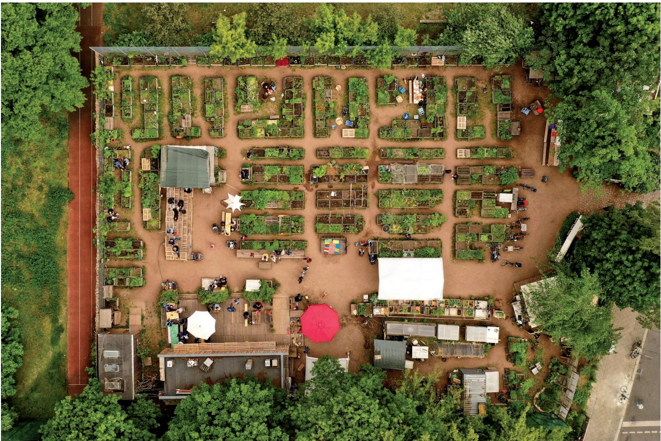
Abb. 1: Reallabor himmelbeet: Aktuelle Fläche des himmelbeet-Gartens