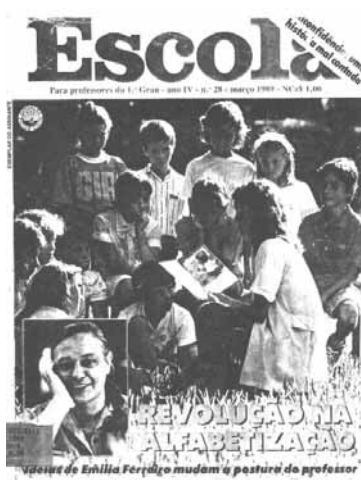
Figura 1 – Março/89

entrevista feita com o ministro da Educação Paulo Renato Souza, que é anunciada numa breve chamada na capa. Nessa introdução, afirma-se que ao ministro cabe "o monumental desafio de transformar o ensino público de primeiro grau numa máquina azeitada e eficiente" (NOVA ESCOLA, 1995b, p.50). Essa "máquina azeitada e eficiente" é o registro em que o professor tende a ficar desde então, em particular no ano de 1996. Passamos assim da preocupação com a postura do professor para o que é da ordem do ensino-máquina, no momento em que tanto o professor quanto os alunos, em particular os da escola pública, perdem boa parte de seu estofa. 14