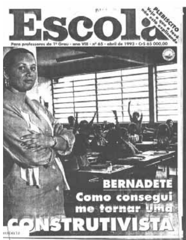
Figura 3 – Abril/93