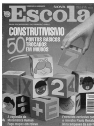
Figura 4 – Março/95