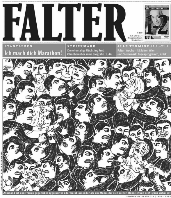
Abbildung 1: »Falter« Titelseite, 13.1.2016

Dort hält eine der sonst amorph-einheitlich gezeichneten Täterfiguren zwei Mobiltelefone in der Hand, was wohl auf die von rechtsextremen Online-Medien verbreitete Lüge anspielt, Flüchtlinge bekämen von Hilfsorganisationen teure Handys geschenkt (Siehe Detail-Darstellung in Abb. 4). Noch bedeutsamer ist aber, dass manche der Männer mit klassischen Attributen der Teufelsdarstellung gezeigt werden. Eine der Figuren hat Teufelshörner, eine andere streckt eine unnatürlich lange, spitze Zunge aus dem Mund (Abb. 5).