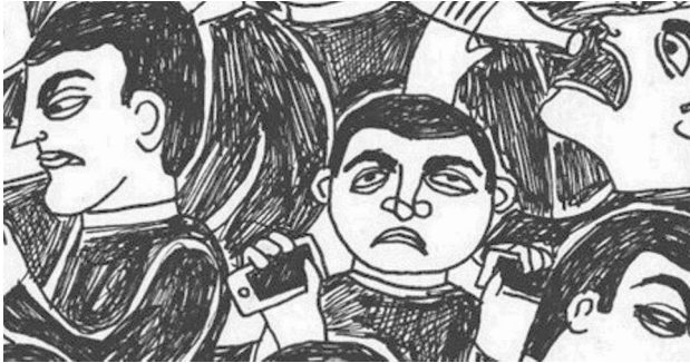
Abbildung 5: »Falter«, 13.1.2016