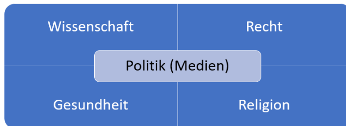
Abbildung 2: Systemtheoretische Krisenanalyse: Der Normal- bzw. Ausgangsfall

Für das eben beschriebene Unterfangen bietet sich eine systemtheoretische Analyse 21 an, die die Situation vor der Krise mit den wichtigsten Veränderungen in der Krise vergleicht. Diese Vorgehensweise wird verdeutlichen, warum religiöse Akteure ihrem Selbstverständnis wie einer unvoreingenommenen Beobachtung nach für eine ambivalente Rolle in der Krise prädestiniert sind, die sowohl wesentlich zur Eindämmung der Corona-Infektionen sowie zur Linderung des von der Krankheit verursachten Leids als auch zur Verschärfung der Situation beitragen kann. Auf eine Darstellung der Feinheiten, Details und internen Problemkreise der Systemtheorie (z. B. die Komplexität der strukturellen Koppelung von Subsystemen oder auch, dass die gerade am Beginn der Corona-Krise feststellbare Hierarchisierung der sozialen Teilsysteme der Grunddiagnose ihrer – für die Moderne typischen – horizontalen bzw. lateralen funktionalen Ausdifferenzierung widerspricht, s. Stichweh 2020) wird bewusst verzichtet. Der an Niklas Luhmann (1984) angelehnte Ansatz dient an dieser Stelle somit lediglich illustrativen Zwecken.