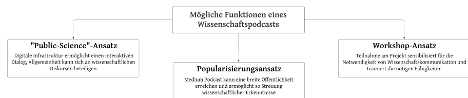
Abbildung 1: Mögliche Ansätze bei der Ausgestaltung eines Wissenschaftspodcasts.

Als Basis unserer Projektreflexion nehmen wir im Folgenden eine systematische Unterscheidung von drei möglichen Ansätzen der Wissenschaftskommunikation vor, die in einem Wissenschaftspodcast verfolgt werden können. Den bewährten Konzepten Wissenschaftspopularisierung und Public Science fügen wir einen dritten Ansatz hinzu, der weniger auf Öffentlichkeitswirksamkeit, sondern vielmehr auf die Übung von Nachwuchswissenschaftler:innen als Kommunikator:innen abzielt (Abb. 1).