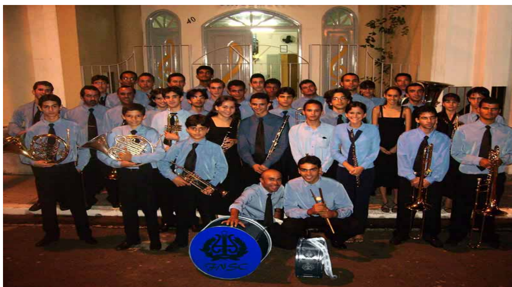
Figura 3 – Foto da Banda Jovem na frente da sede do Complexo musical em Itabaiana em 2007.

O corpo docente do complexo musical de Itabaiana se compõe por professores de nível superior e monitores para lecionarem desde as formações iniciais até os grupos mais avançados. Sua atividade pedagógica se dá na Escola de Música da Instituição, denominada de “Antônio Melo”, em homenagem a um ex-integrante da N. S. C. Ainda constam um arquivo-museu, biblioteca e sala para ensaio e apresentações, tendo o patrocínio da prefeitura municipal local, além de empresas do setor privado, fazendo da Filarmônica, do complexo, um instrumento educacional, que vem hoje em dia ampliar a educação musical de Itabaiana.