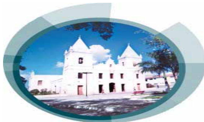
Figura 2 – Fotografia da igreja no local de fundação de Itabaiana.