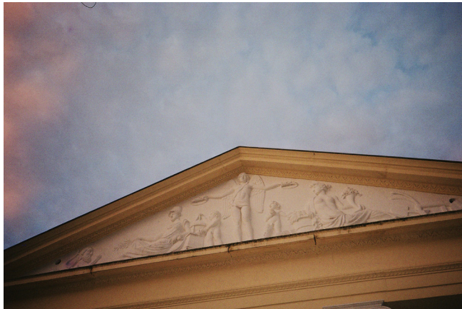
Abbildung 2: Das Giebelrelief von Johann Peter Kaufmann am Römischen Haus zeigt die Vereinigung von Kunst, Wissenschaft, Obst- und Ackerbau