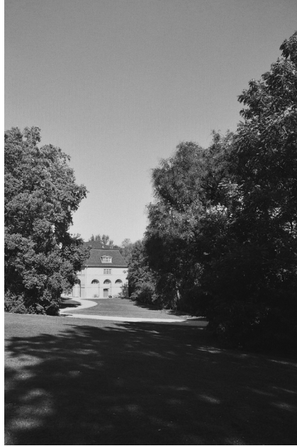
Abbildung 3: Das großherzogliche Reithaus an der Ilm: Hier sollte durch das Bauhaus eine „Probierwerkstatt“ zur fachübergreifenden Projektarbeit eingerichtet werden

zielende Bewirtschaftung eines Ackers auf dem Gelände am Horn (vgl. Gropius 1987: 93) zeugen diesbezüglich von den vielfältigen naturverbundenen Ansätzen und Strategien, sich den Raum in diesem Sinne anzueignen. In der studentisch geleiteten Mensa wurden die selbst geernteten Erzeugnisse nach Rezepten der fernöstlichen Mazdaznan-Lehre zubereitet (vgl. Schlemmer 1994b: 458). Der Meister Lothar Schreyer, der in unmittelbarer Nachbarschaft zum Park im Dachboden des Hauses Charlotte von Steins wohnte, berichtet von