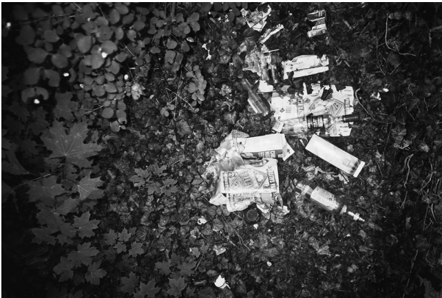
Abbildung 1: Der Park an der Ilm hinter dem russischen Ehrenfriedhof: Detailansicht

angegriffen und gefährdet. Unvorhersehbar werfen alte Bäume große Äste ab und führen damit zu einer Beeinträchtigung der Verkehrssicherheit. Zahlreiche Bäume mussten daher gefällt werden (vgl. Grau 2018). Pflanzen und Wiesen leiden, Wege und Uferbereiche werden durch starke Regenfälle unter- oder abgespült. Unbeglehbare Wege, Baustellen und unsichere Bereiche führen immer häufiger zur Sperrung ganzer Parkpassagen (vgl. Grau et al. 2018). Ein sich veränderndes Nutzungsverhalten, neue Ansprüche und daraus resultierende Interessenskonflikte haben zuletzt zu einer erheblichen Vermüllung, Auseinandersetzungen und Vandalismus geführt und stellen die verantwortliche Klassik Stiftung mit der Bewirtschaftung des Parks vor substantielle Herausforderungen (vgl. Weber 2020).