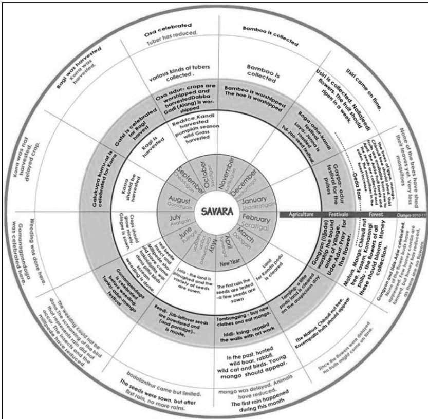
Abbildung 1: Savara Adivasi life cycle. Vykunta, Adivasi Aikya Vedika, India (Quelle: Ramdas/FSA 2016).

Vor diesem Hintergrund haben mehrere innerhalb von FSA organisierte indigene Gemeinschaften in einem längerfristigen kreativen Prozess ‚Lebenszyklen‘ (life cycles) erstellt. Dabei handelt es sich um den saisonalen Jahreskalender einer spezifischen Adivasi-Gruppe (hier der Savara), bildlich dargestellt in Form eines Kreislaufes, der entlang der zwölf Monate die land- und forstwirtschaftlichen sowie kulturellen Aktivitäten abbildet.