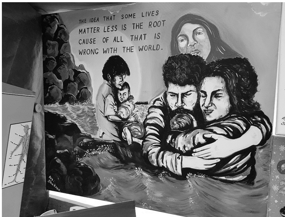
Fotografia 8. „Przekonanie, że życie niektórych ludzi ma mniejszą wartość, jest korzeniem wszelkiego zła na świecie”, Moria, Lesbos, 28.11.2019 r.

Rozmówcy dziennikarzy „The Guardian” przedstawiają warunki na Moria jako trudne do opisanego: „Często nie ma wody, nie ma elektryczności. Obawiamy się o życie naszych dzieci, że umrą z powodu deszczu, zimna i wiatru. Dla Syryjczyków jest to piekło. Jesteśmy bezdomni, nasze miasto, Idlib w Syrii, jest miejscem walki. Musieliśmy je opuścić, ale czasami uważamy, że Moria to tylko miejsce oczekiwania na śmierć. Życie w Morii jest niemożliwe – uwierz mi – większość z nas zmieniła się psychicznie. Niektórzy ludzie oszaleli” 22 .