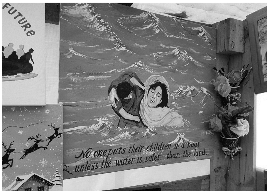
Fotografia 7. Obraz z „pracowni artystycznej”, Moria, Lesbos, 28.11.2019 r.