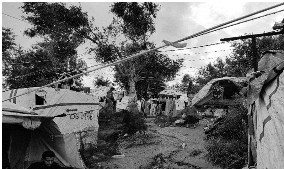
Fotografia 2. Typowy obraz z „obozu nieoficjalnego” – Moria, Lesbos, 28.11.2019 r.

Poniższe zdjęcia wykonane były półtora miesiąca wcześniej przed raportem cytowanych dziennikarzy. Oddają one tylko częściowo warunki, w jakich ludzie tam mieszkają czasem przez wiele miesięcy.