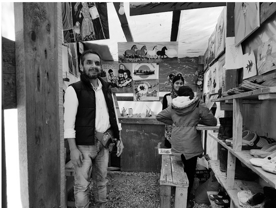
Fotografia 6. Moria, Lesbos, 28.11.2019 r.