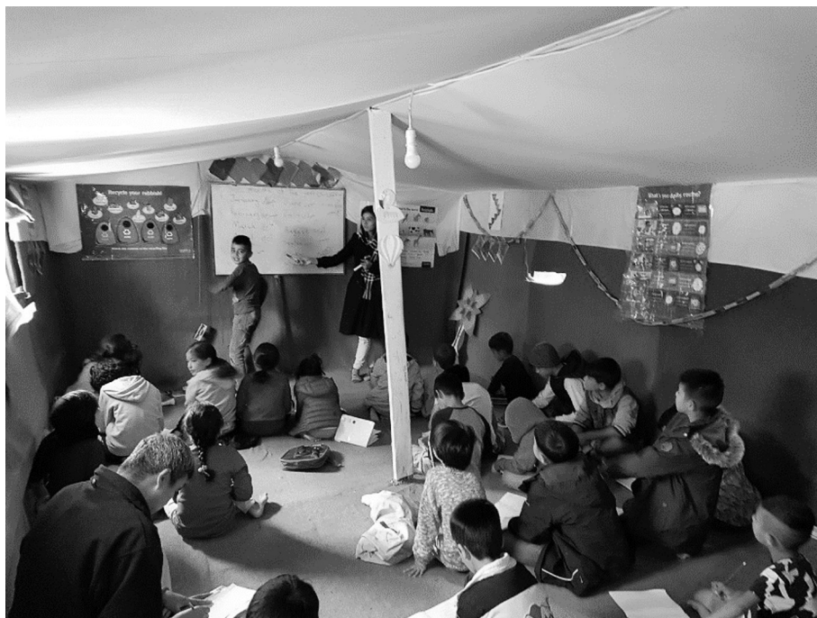
Fotografia 5. „Szkoła” – Moria, Lesbos, 28.11.2019 r.

W tym prymitywnym obozie można było stwierdzić oznaki pewnej zdolności do samoorganizacji, o czym świadczyć może poniższe zdjęcie rejestrujące prowadzenie zajęć lekcyjnych.