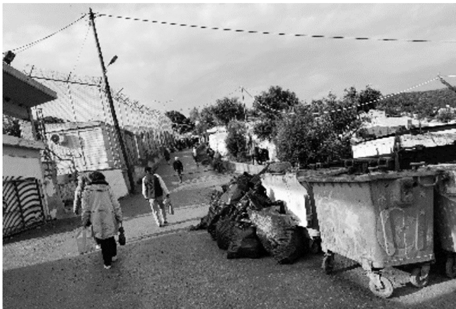
Fotografia 1* . Droga dzieląca obóz oficjalny (lewa strona) od obozu „nieoficjalnego”, Moria, Lesbos, 28.11.2019 r.