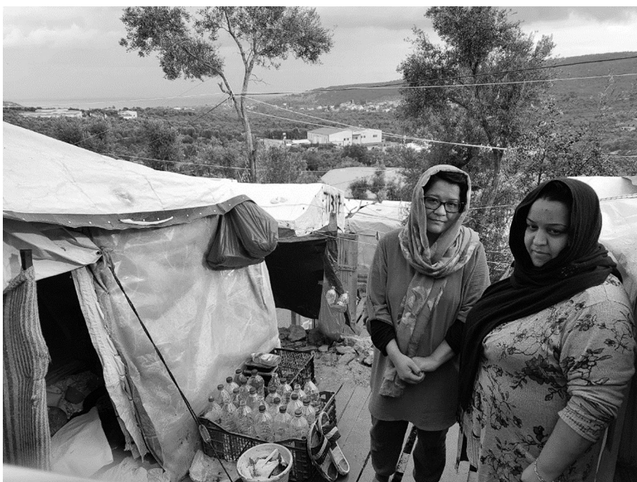
Fotografia 4. Dwie Afganki – Moria, Lesbos, 28.11.2019 r.