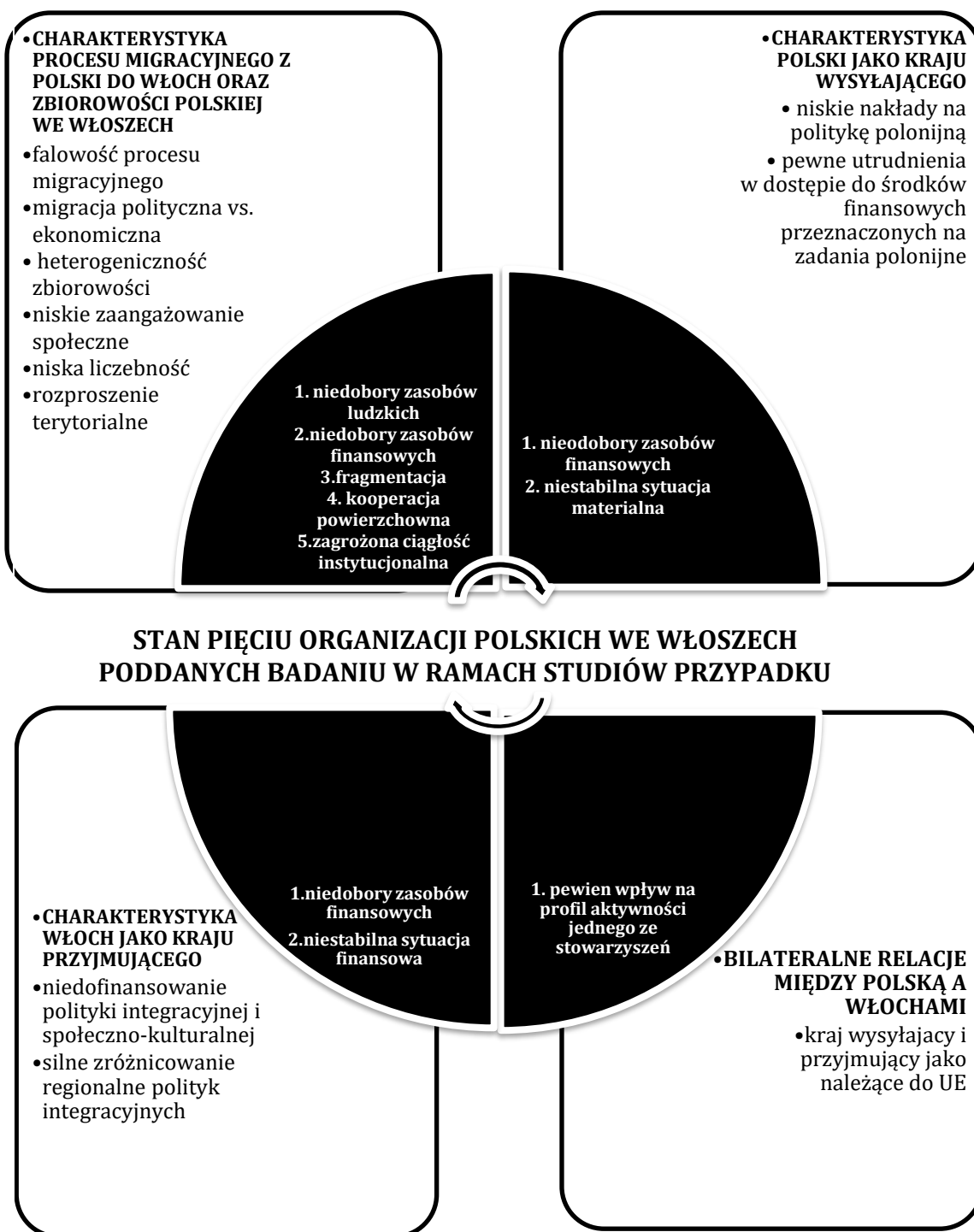
Schemat 3. Główne czynniki – w ujęciu badanych – wpływające na stan pięciu analizowanych organizacji