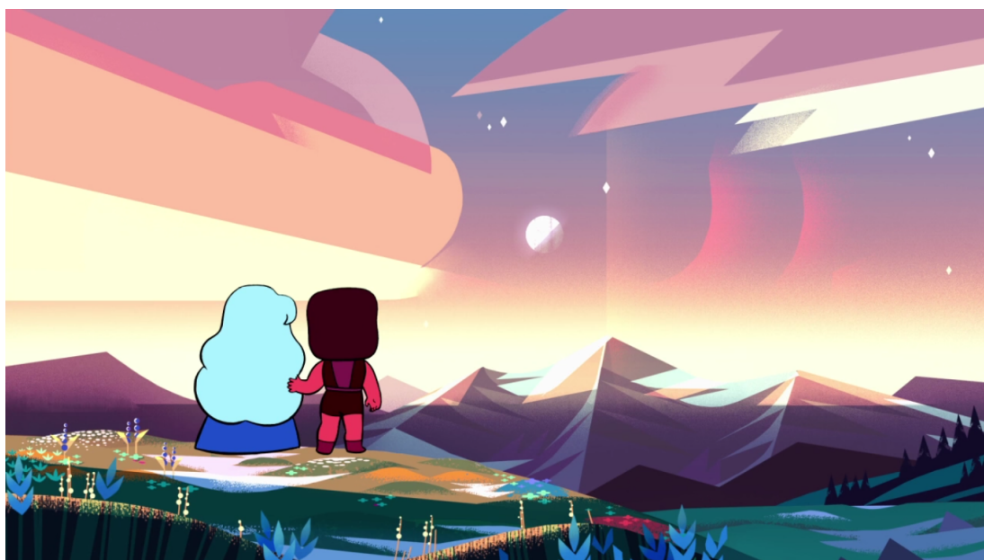
Abb. 2-1: Stimulus A: „Steven Universe: Die Antwort“

Steven Universe ist die erste von einer weiblichen Produzentin, Rebecca Sugar, realisierte us-amerikanische Science-Fiction -Trickfilmserie für Kinder, Jugendliche und Erwachsene. Hauptfigur ist der Junge Steven Quartz, welcher sich im Verlauf der Serie vom Kind zum Erwachsenen entwickelt und dabei mehr über seine Umwelten, die Personen in ihnen und sich selbst erfährt. Die Mission seiner nächsten Bezugspersonen (die Gems Amethyst, Garnet und Pearl), welche in der Zeit der Abwesenheit seiner Mutter auf ihn aufpassen, ist es, die Welt zu beschützen. Auch sie entwickeln sich im Verlauf der Serien weiter.