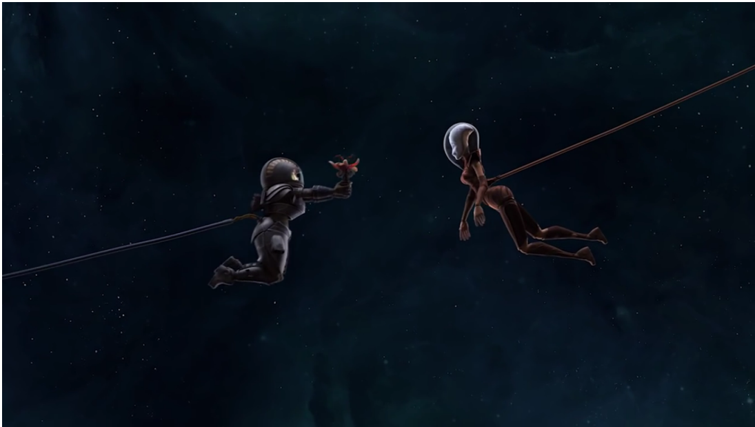
Abb. 2-2: Stimulus B: „Orbitas“

Orbitas ist ein kurzer 3D-Animationsfilm (8:34 min) von Jaime Maestro und Student*innen von PrimerFrame. Escuela de Animacion , Valencia. Es wird die Geschichte erzählt, wie zwei Astronautinnen zweier verfeindeter Länder aufgrund ihrer gegenseitigen Zuneigung füreinander (Blumen, Tanzen, sich umarmen) zusammenhalten. Außer Aussagen der Befehlshaber in Fantasiesprachen wird im gesamten Film – insbesondere von den beiden Protagonistinnen - nicht gesprochen.