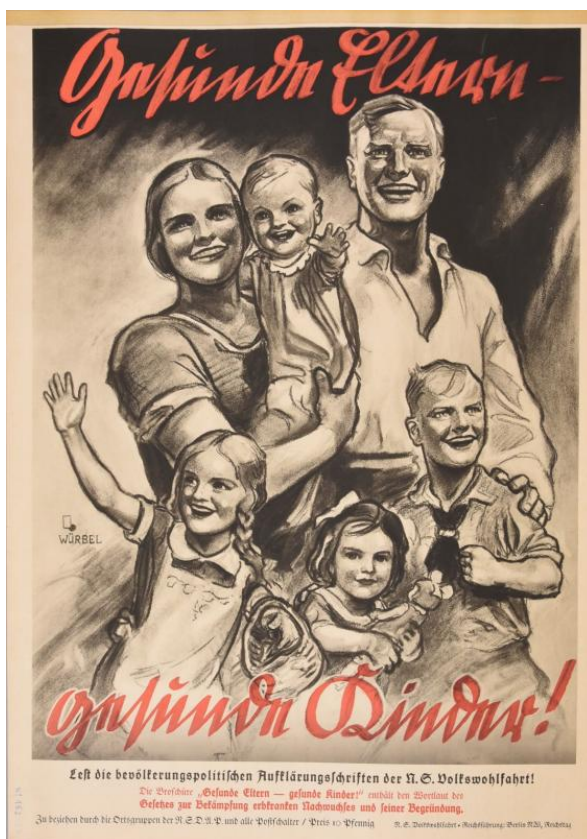
Abbildung 3. Plakat der NS-Volkswohlfahrt, 1936

Quelle: Sammlung Deutsches-Hygiene Museum Dresden, Inventar-Nummer 2004/0960.4.