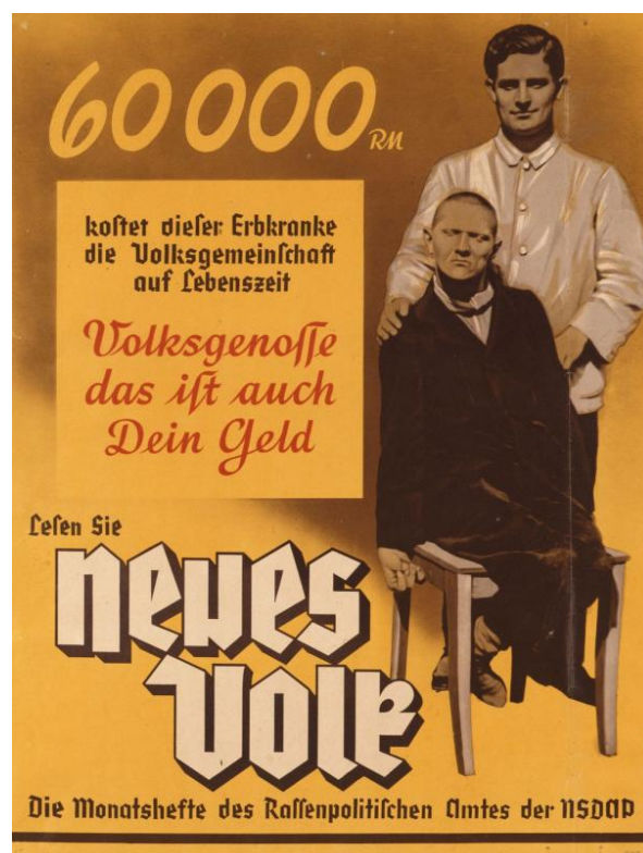
Abbildung 1. Propagandaplakat für das Monatsheft Neues Volk , herausgegeben vom Rassenpolitischen Amt der NSDAP (1938)

Quelle: © Deutsches Historisches Museum, Berlin 2020, Inv.-Nr.: 1988/1284